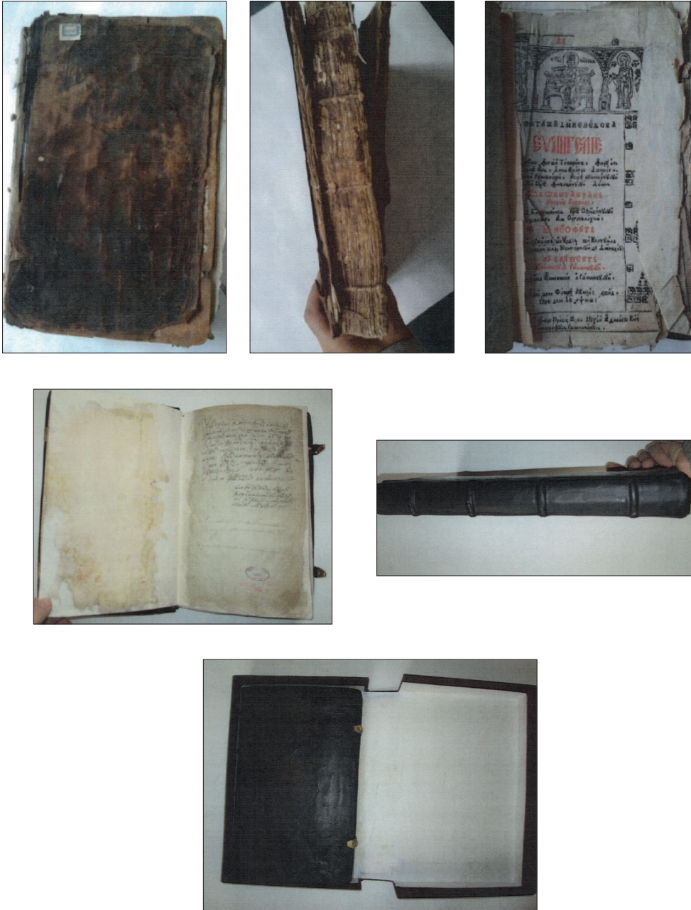
Fig. 2 Evanghelie, Râmnic, 1746 (înainte și după restaurare)