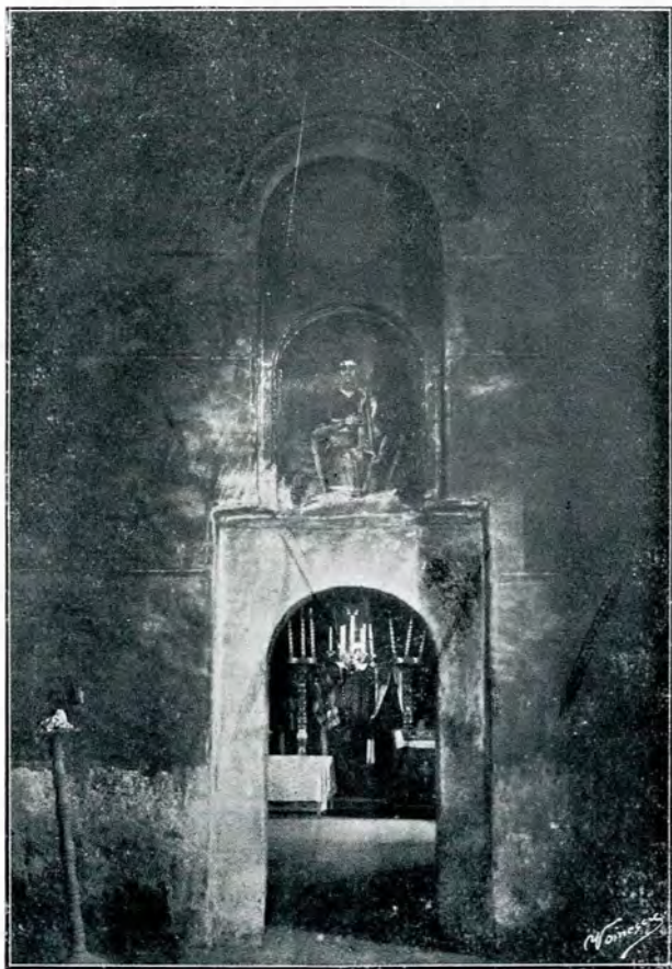
4. Vedere în interiorul bisericii din Corbii Mari.