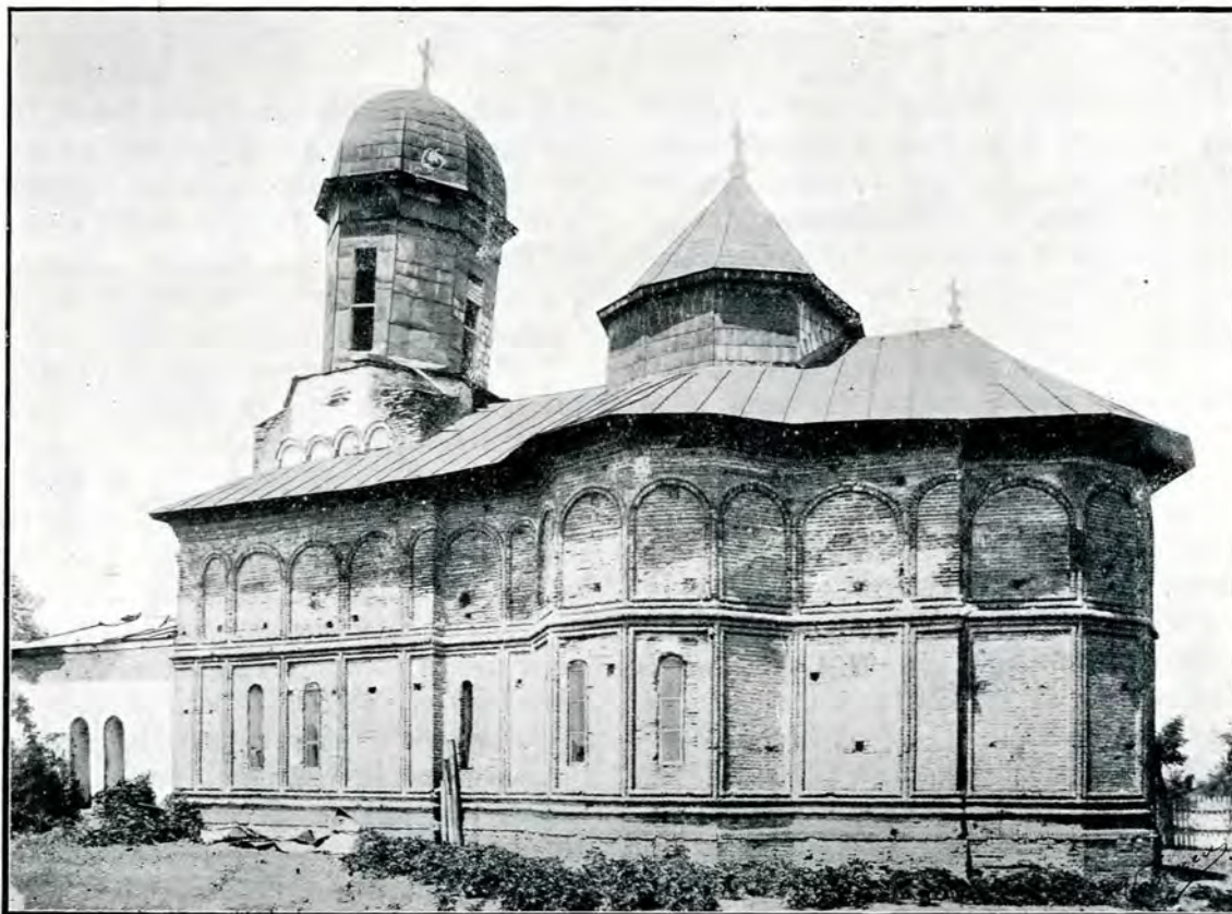
1. Biserica din Corbii Mari.

«lordachie Beizadea, sin Antonie Vodă, ea «ii talmăcia de toate la Turc, fiind și rudă «amândouă și nădăjduind ca să fie frate-său «Domn, sin Grigorie Vodă, — cu care i-au «trimis o mahramă cu sârmă, zicându-i că «acea mahramă să fie semn, și când ar putea «isprăvi ceia ce între dâșii au vorbit și au «socotit, acea mahramă să o trimită în chip «de semn, ca să lipsească cărți și alte scri-«sori, pentru ca să nu li se întâmple vre-o «descoperire sfatului lor celui drăcesc. Pă-«gânul de turc (însă), luând mahrama și ră-