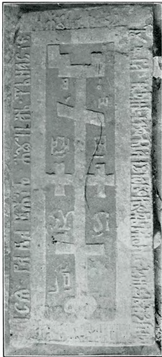
Piatră mormântală dela bis. din Călinești-Prahova.

a) Прѣстави се рава ѿжиѣ жєпаниѣ тѣ- насіє и жєпаница єго тѣдѣра въ дни Іо Матѣю Гонимѣ, мѣ. кнѣ днѣ с, вѣкт. зєрдѣ.