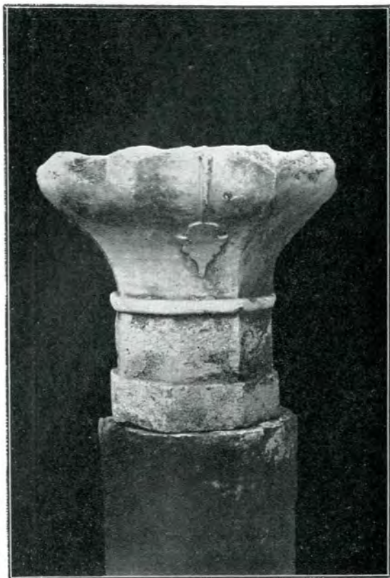
Capitel sculptat găsit în ruinele palatului lui Ștefan-cel-Mare din Vaslui.

Pe lângă pisania palatului dela Hârlău, păstrată în Muzeul Național, acest fragment