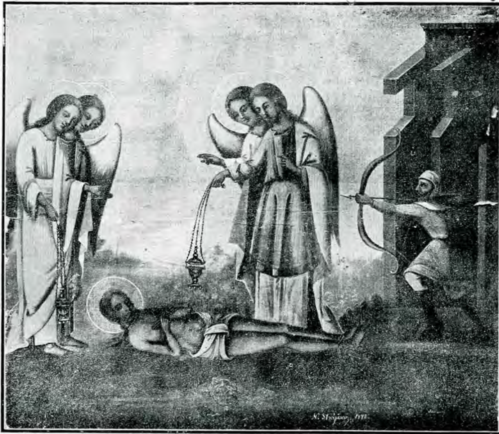
16. Icoana nouă, zugrăvită pe dosul celei vechi (fig. 15), reprezentând același subiect

se întâmplă după ce se tăia capul Sfântului, în mahalaua jidovească din Cetatea Albă. Din corpul lui, rămas, peste noapte, întins pe pământ, se văzu eșind atunci un stâlp de foc, întărit până la cer, iar trei bărbați cântând cu dulceața îngerească, tă-măiau împrejurul mortului. Un jidov vecin văzând această arătare și socotind că preoții creștini au venit să ridice corpul martirului, și să-l îngroape depe datina creștinilor, încercă a trage asupra celor trei cu arcul; dar în