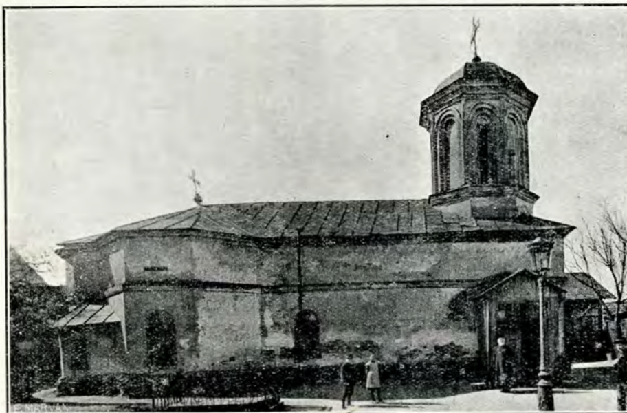
Fig. 3. Biserica Spirea Veche, în forma actuală.

două firide laterale, diaconiconul și proscomidia (fig. 4, IV).