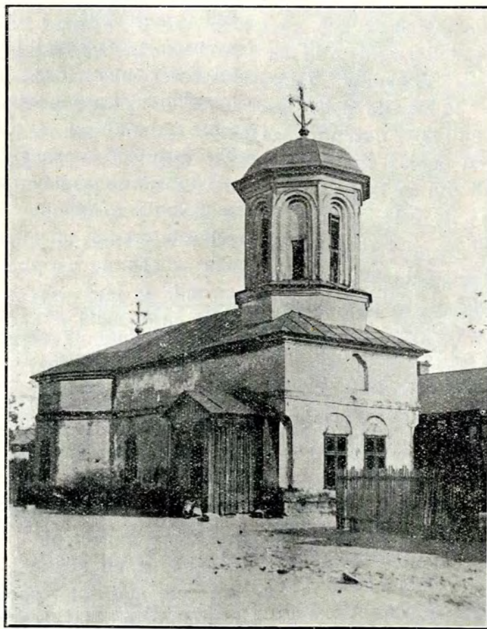
1. Biserica Spirea Veche. Vedere spre Nord-Vest.

Cu atât mai pitorească apărea astfel în simplitatea ei, mai ales, prin interiorul ei cârpit, înădit și afumat.