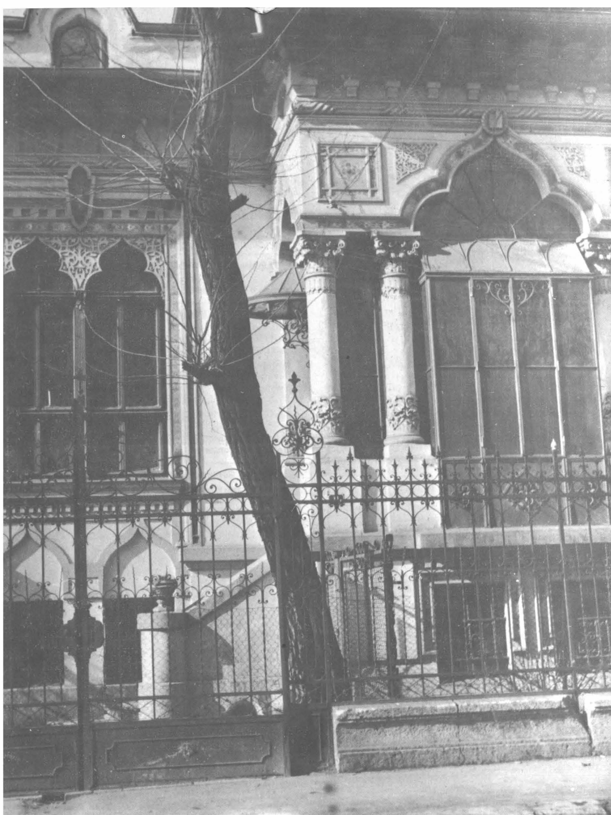
Fig.3.Casa Ionescu Gion (1885), str.arh.I.N.Socolescu