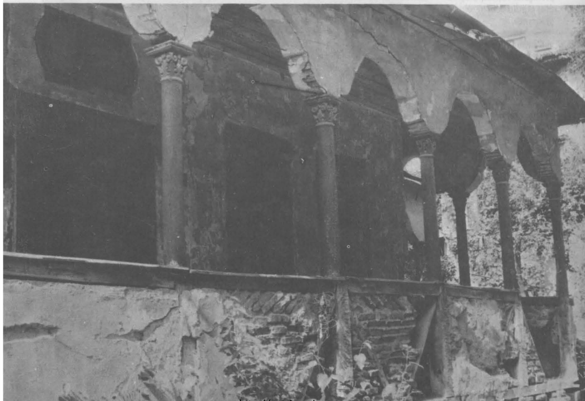
Fig.2.Casă de târgoveți, str.Șerban Vodă nr.33, pridvorul