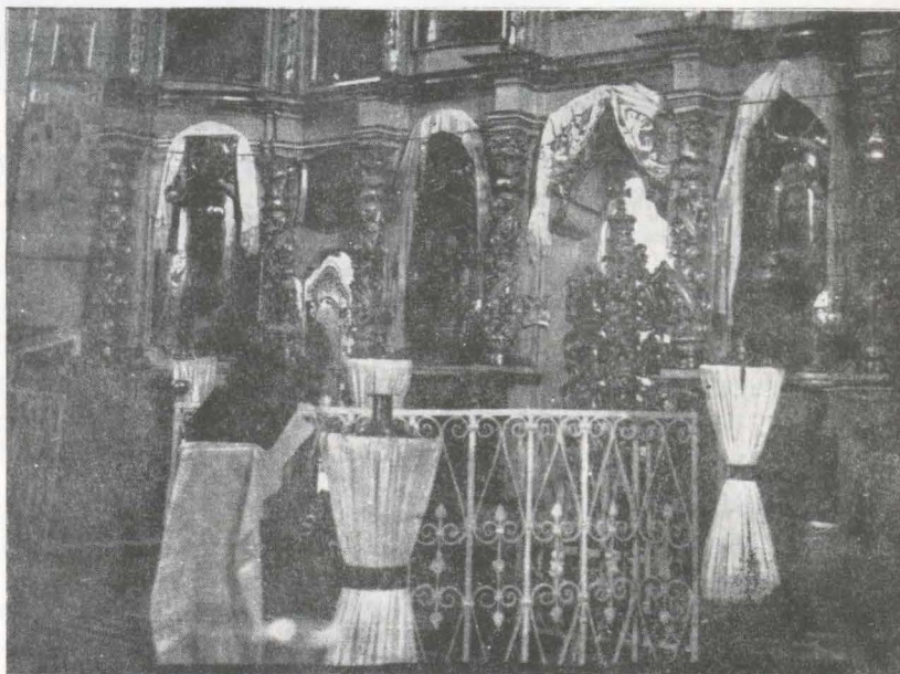
Imagine a altarului bisericii (1940)

Adevărata comoară a cărților, inventariată și tipărită în «Buletinul Comisiunii Monumentelor Istorice» din 1924 2 o formau însă cele în