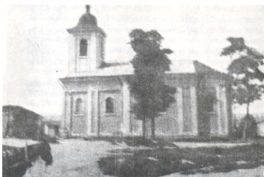
Imagine a bisericii din 1960

1827; Penticostarion , Chișinău, 1853; Ceaslov , Chișinău, 1862 și altele.