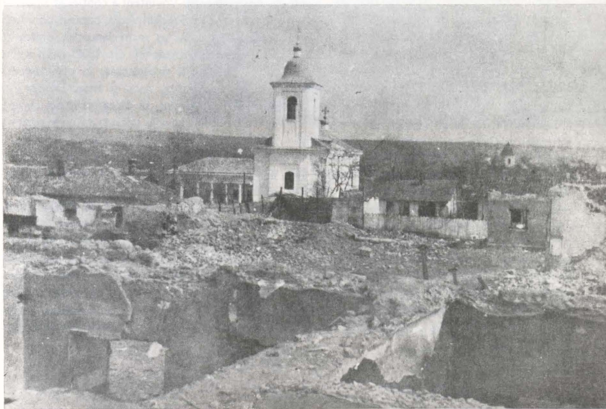
Biserica Sf. Arhangheli « Soborul Vechi » din Chișinău în 1942

Biserica zidită de Lupul Năstasă a dăinuit pînă la războiul ruso-turc (1789—1792), cînd Chișinăul a fost ars de turci în retragerea lor. După mărturiile martorului ocular maior secund von Raan, sub cenușă zăceau șase biserici, între care și biserica Sf. Arhangheli.