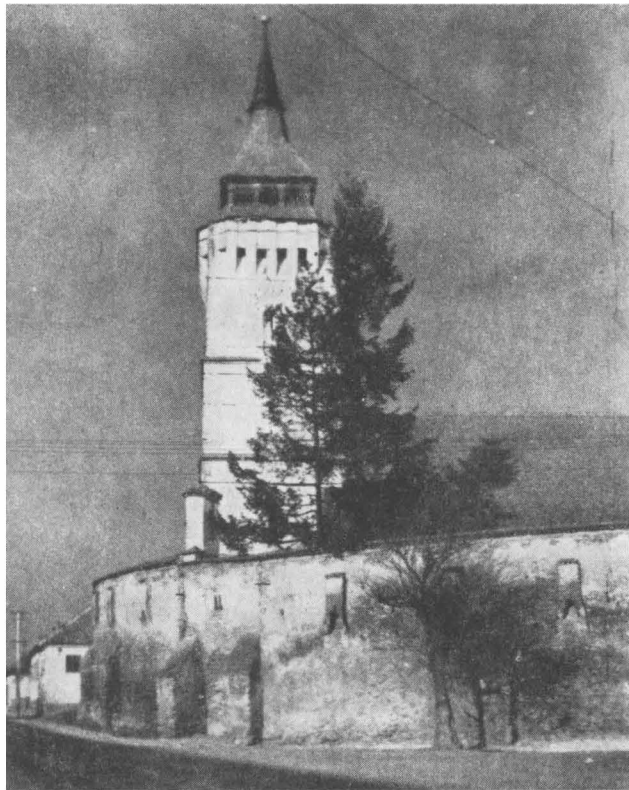
Zidul de incintă la Rotbav, jud. Braşov — burdufuri pentru păcură ieşite în consolă.