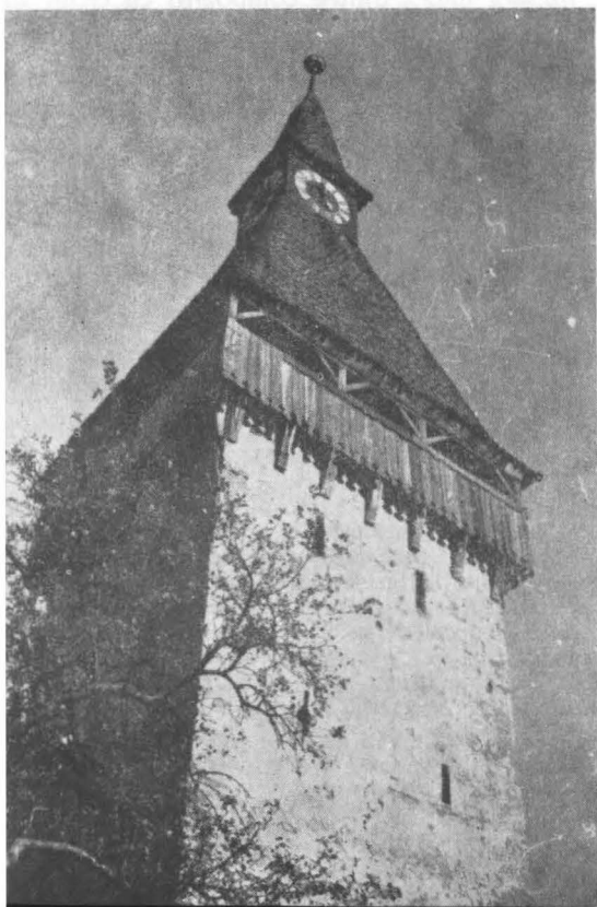
Turnul cu ceas al bisericii-cetate Biertan — detaliu, galerie de apărare cu parapet de lemn.