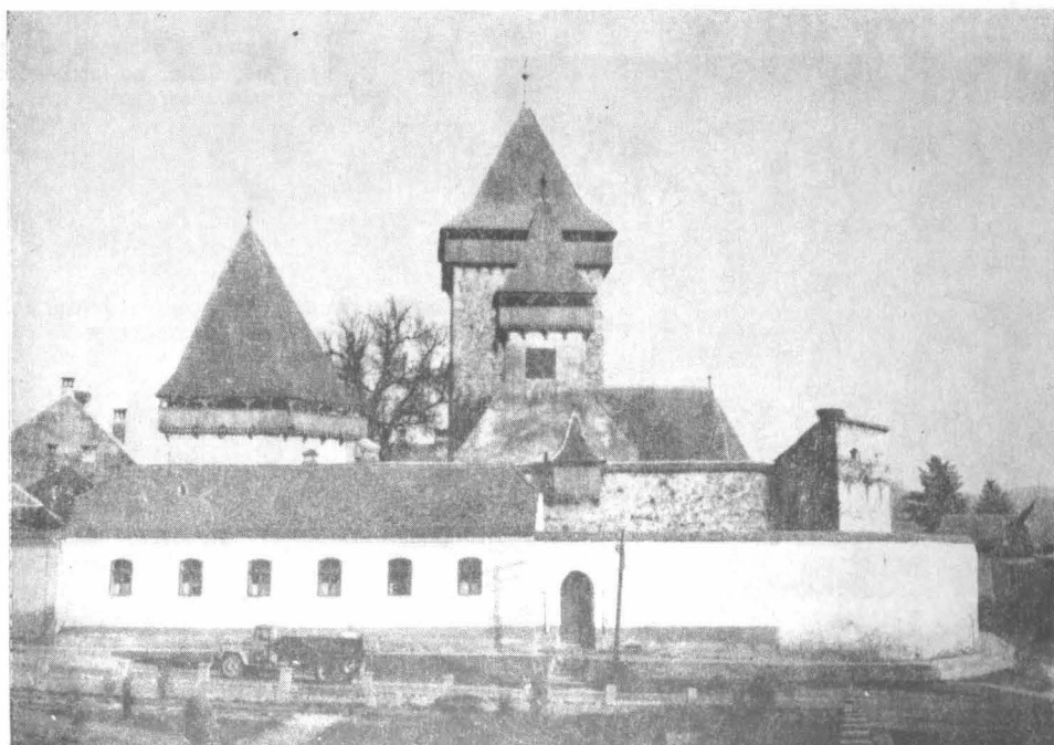
Biserica-cetate Homorod, jud. Brașov — vedere generală.

După marea invazie a tătarilor din 1241 se ridică, cu îngăduința regală, numeroase reședințe nobiliare fortificate, fortificații de orașe, cetăți țărănești de refugiu ce adăposteau mai multe comune. Acestea, situate în locuri inaccesibile, pe culmi de deal, au fost abandonate, multe dintre ele în momentul în care au apărut bisericile fortificate.