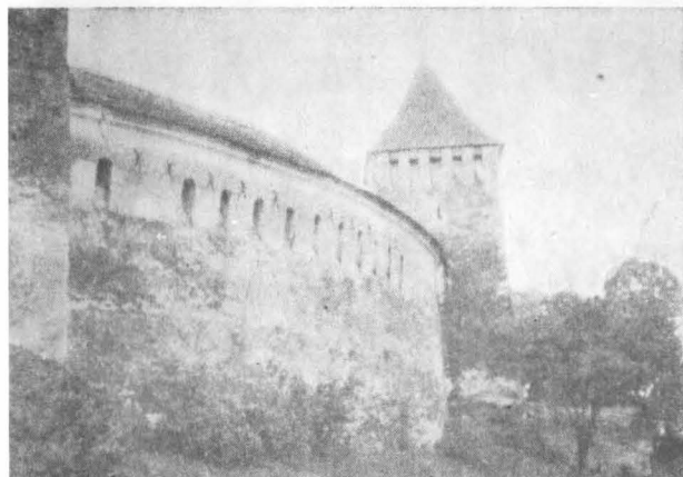
Turn şi porţiune de incintă (la Hărman, jud. Braşov) guri de păcură rezolvate în grosimea zidului.

pod ridicător cu o porţiune mobilă în dreptul porţii.