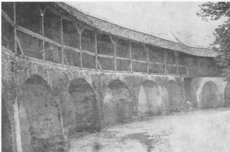
Incinta bisericii Valea Viilor, jud. Sibiu — drum de strajă pe arcade de zidărie.