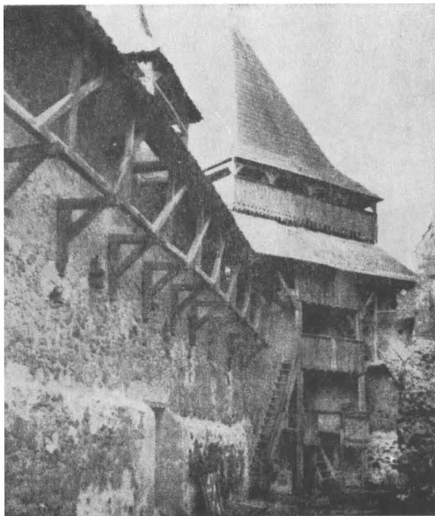
Drum de strajă pe console de lemn la biserica-cetate Homorod, jud. Braşov.

La Sînpetru, zwingierul a fost dublat, cetatea compunându-se din trei incinte concentrice.