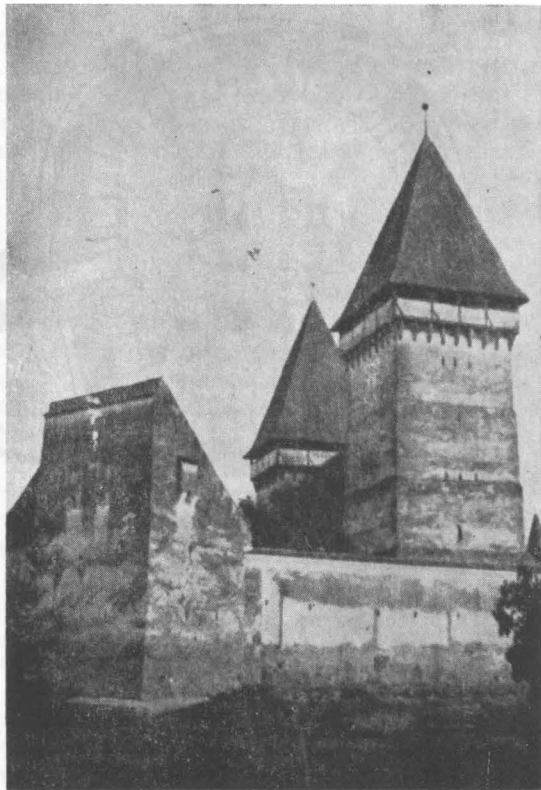
Turn cu acoperiş în pupitru — incinta fortificată Dealul Frumos, jud. Sibiu.