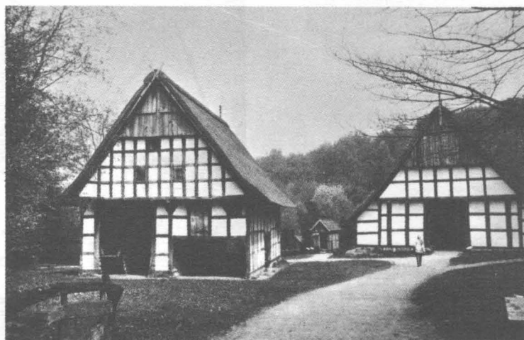
Fig. 1. Complexul de clădiri al fermei din Osnabrück. În plan secund – casa construită în anul 1609; are dimensiunile generale de 35/15 m. Casa a fost demontată în anul 1962 și remontată în anii 1967 – '68. În primul plan se află hambarul, care are și spații de adăpostire a atelajelor.

Extrem de complex, interiorul oricărei case de fermă cuprinde spații de lucru, de adăpostire a animalelor și spații de locuit. Totul este închis în volumul construcției, accesul realizându-se printr-o poartă masivă. Suprafața cea mai mare o ocupa aria de treierat, care era folosită și pentru festivități ocazionale. Pe margini se aflau staulele pentru animale, iar deasupra lor – mici depozite pentru furaje și unelte ușoare. În vecinătatea acestora se înșiruie mici camere pentru servitori sau muncitorii fermei. Spre capătul opus intrării sunt amenajate bucătăria și încăperile pentru dormit ale proprietarilor. Spațiul propriu-zis de locuire are dimensiuni foarte reduse în comparație cu spațiile