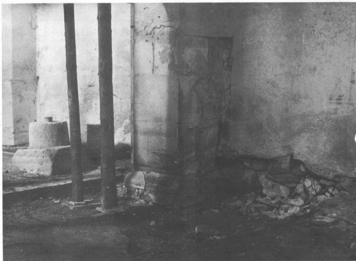
3. Vedere din interiorul bisericii; pilonul nordic al arcului de triumf

Poziția oaselor – capul cu bărbia în piept, umerii ridicați, coloana vertebrală șerpuită – sugerează faptul că înmormântarea s-a făcut în giulgiu, înainte de rigidizarea corpurilor. Gropile acestor morminte au în partea superioară o formă dreptunghiulară simplă, dar spre fund se îngustează treptat (în două-trei trepte orizontale) astfel încât la nivelul scheletului capătă exact forma corpului uman; lăcașul pentru cap este întotdeauna rotunjit. Toate gropile se adâncesc în solul viu, galben lutos, și datorită faptului că acesta coboară în pantă pe direcția sud-vest – nord-est, scheletele se găsesc la adâncimi care variază între 1,30 și 3,10 m.