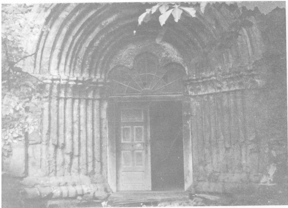
1. Portalul bisericii Drăușeni, sec. XIII