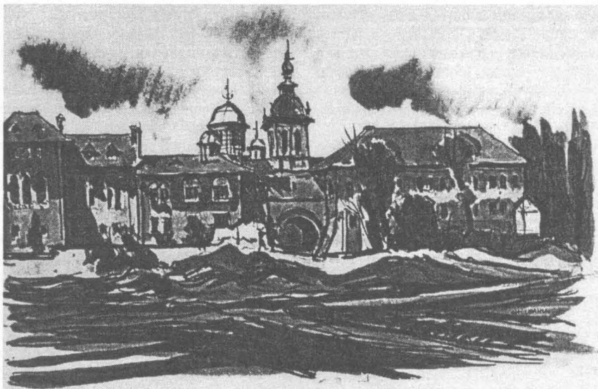
Planșa I – Mănăstirea Mihai Vodă și Arhivele Statului