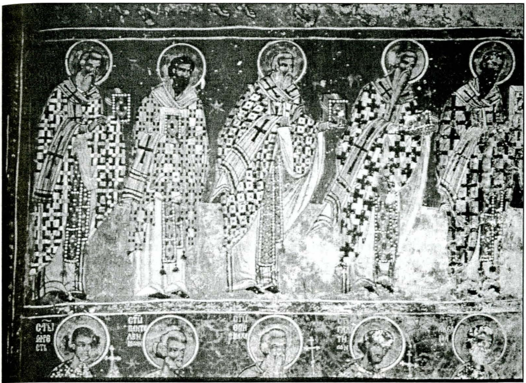
Fig. 1. Biserica mănăstirii Humor. Detaliu pictură murală exterioară, "Procesiunea tuturor Sfinților". Foto Vasile Drăguț, Fototeca INMI, Fond DMI, 1961.

Textul invocat al profesorului Drăguț debuta, pentru cei ce aveau urechi să audă și minte să înțeleagă, cu anamneza unei Europe devastate de catastrofele celor două războaie mondiale, autorul văzând în „cazul polonez”, al reconstrucțiilor ample, „nobilul efort de recuperare a monumentelor și valorilor patrimoniale deteriorate sau uneori de-a dreptul nimicite.” Cine își mai amintește astăzi, când individualismul cinic, acompaniat de o devastatoare ignoranță, invadează conștiința publică, de modul în care rezonau cuvintele lui Drăguț în sufletele celor care văzuseră căzând, împreună cu expresiva arhitectură vernaculară din centrul istoric al Bucureștilor, monumente precum Biserica Ienei sau Văcăreștii 4 ? În trista alegorie a patrimoniului românesc, Drăguț întvedea soluția recu-