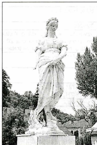
2/29 – Statuia din apropierea izvorului de stomac