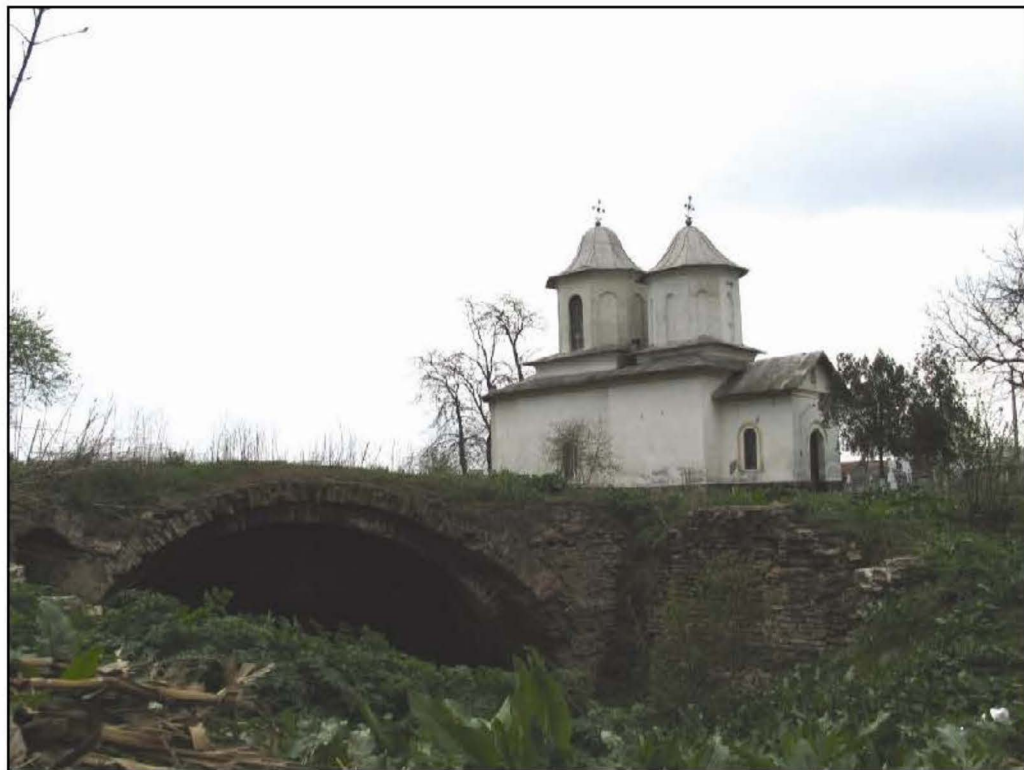
Fig. 1 Biserica Adormirea Maicii Domnului, Didești. În prim plan - ruina pivniței

incintei, aceasta din urmă construită după anul 1708, conform dispoziției ctitorului 15 , și o clopotniță de lemn exterioară, cu clopotul mare turnat la Moscova, în anul 1846 16 .