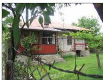
Fig. 10. Măneciu Ungureni, str. Costești nr. 307. Casa Maria Ionescu. 2006

Casa Maria Ionescu (inc. sec. XX), str. Costești nr. 307, cod PH-II-m-B-16536, este locuință temporară și se află în stare bună de conservare. (Fig. 10)