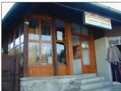
Fig. 16 Gheaba, str. Gării nr. 416. Casa cu prăvălie Nicolae Matei. 2006