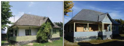
Fig. 11. Măneciu Ungureni, str. Tabla Buji nr. 15. Casa Ioana Badea. 2004 și 2006

Casa Eliena Cârstocea (sf. sec. XIX – inc. sec. XX), nr. 654, cod PH-II-m-B-16498, în anul 2004 se afla în stare de colaps. Ulterior, în intervalul noiembrie 2004-2006, casa a fost