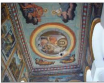
Fig. 7 Mănăstirea Cheia Biserica „St. Treime”. Pictură prdnor 2007

Casa Gheorghe Angelescu (sf. sec. XIX), nr. 172, cod PH-II-m-B-16534, este locuită temporar și se află într-o stare medie de conservare.