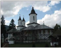
Fig. 5-6 Mănăstirea Cheia. Biserica „Sf. Treime”, 2000 și 2007

Totodată în locul bulbului originar a fost plasat un tip de bulb inadecvat contextului volumetric, conducând astfel la schimbarea formei originare a părții superioare a acoperișului