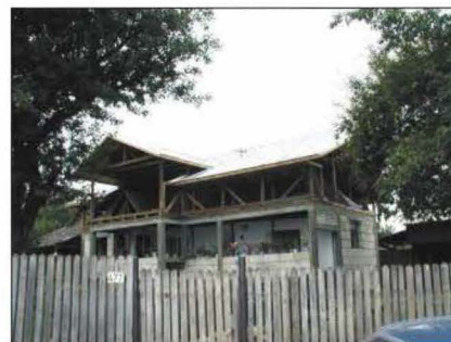
Fig. 17 Gheaba, str. Tabla Buții nr. 477. Casa Eugenia Prunuță. 2006