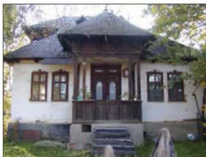
Fig. 18 Gheaba nr. 126. Propunere nouă