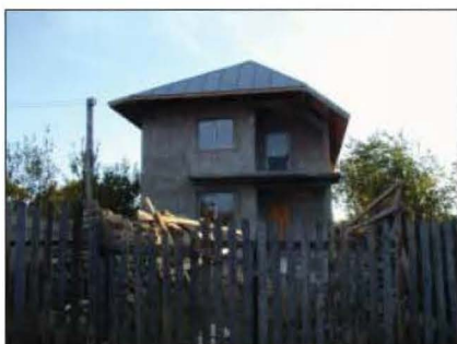
Fig. 14 Gheaba. 2006. Construcție nouă pe locul Casei Elena Cârstocea, nr. 654