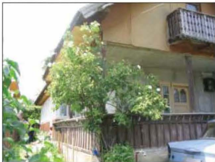
Fig. 12 Măneciu Ungureni, str. Tabla Buții nr. 269. Casa Neonila Pisu. 2006