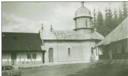
Fig. 1 Mănăstirea Cheia Paraclisul și chiliile de pe latura de nord a incintei. 1963

Fațadele au fost foarte grav afectate, pe latura de sud a acestor chilii, deschizându-se goluri pentru uși și ferestre, ignorându-