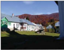
Fig. 8 Mănăstirea Suzana Chilile de pe latura de nord 2006