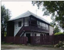
Fig. 9 Măneciu Pământeni, nr. 216