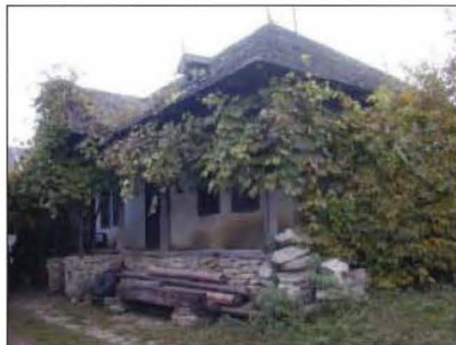
Fig. 13 Gheaba nr. 505. Casa Ion Baci. 2006