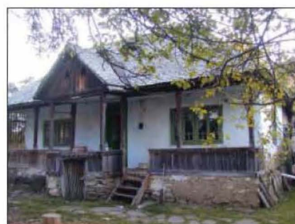
Fig. 15 Gheaba nr. 660. Casa Ion Savu. 2006