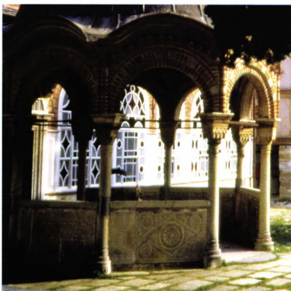
II. 11. Megas Lavras - fiala