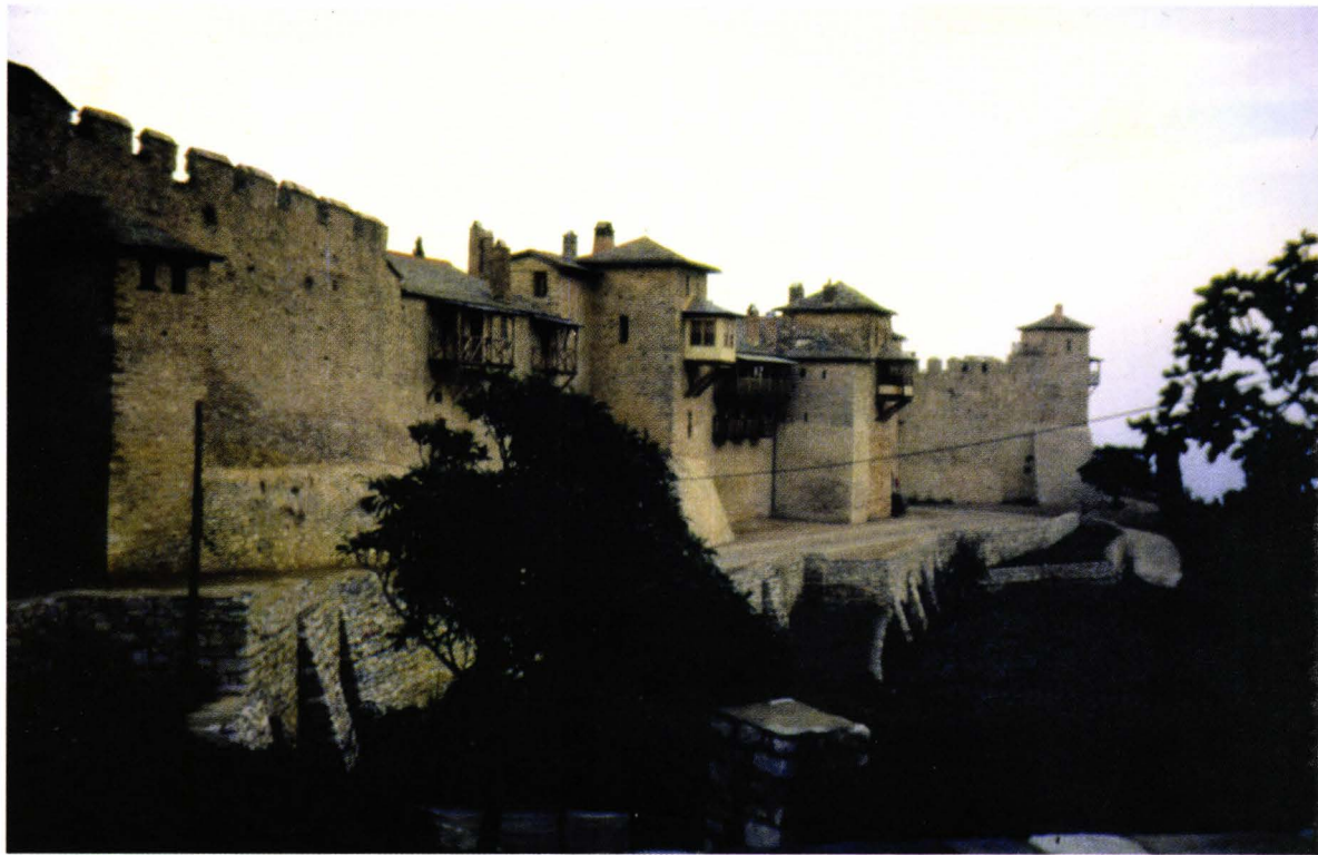
II. 4. O veritabilă cetate medievală (Megas Lavras)