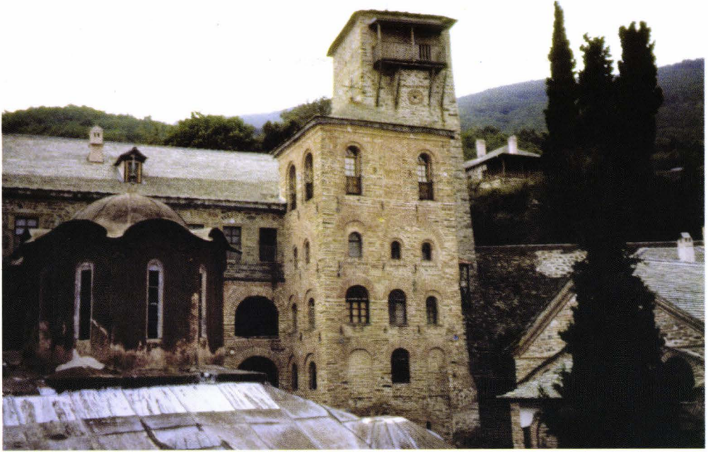
II. 19. Koutloumoussiou - pîrgul lui Neagoe Basarab (în plan secund)