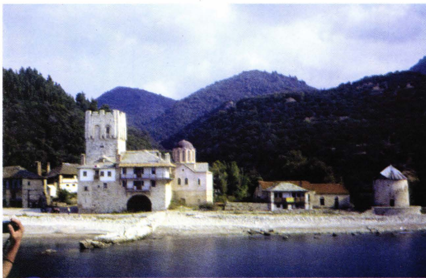
II. 14. Zografou - arsana lui Ștefan cel Mare