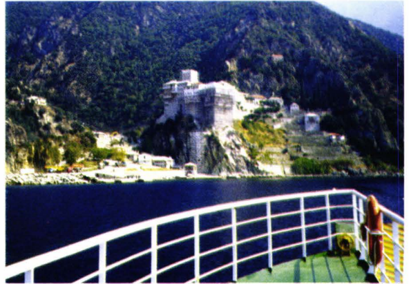
II. 25. Agiou Dionyissiou (Neagoe Basarab, Petru Rareș, Alexandru Lăpușneanu)