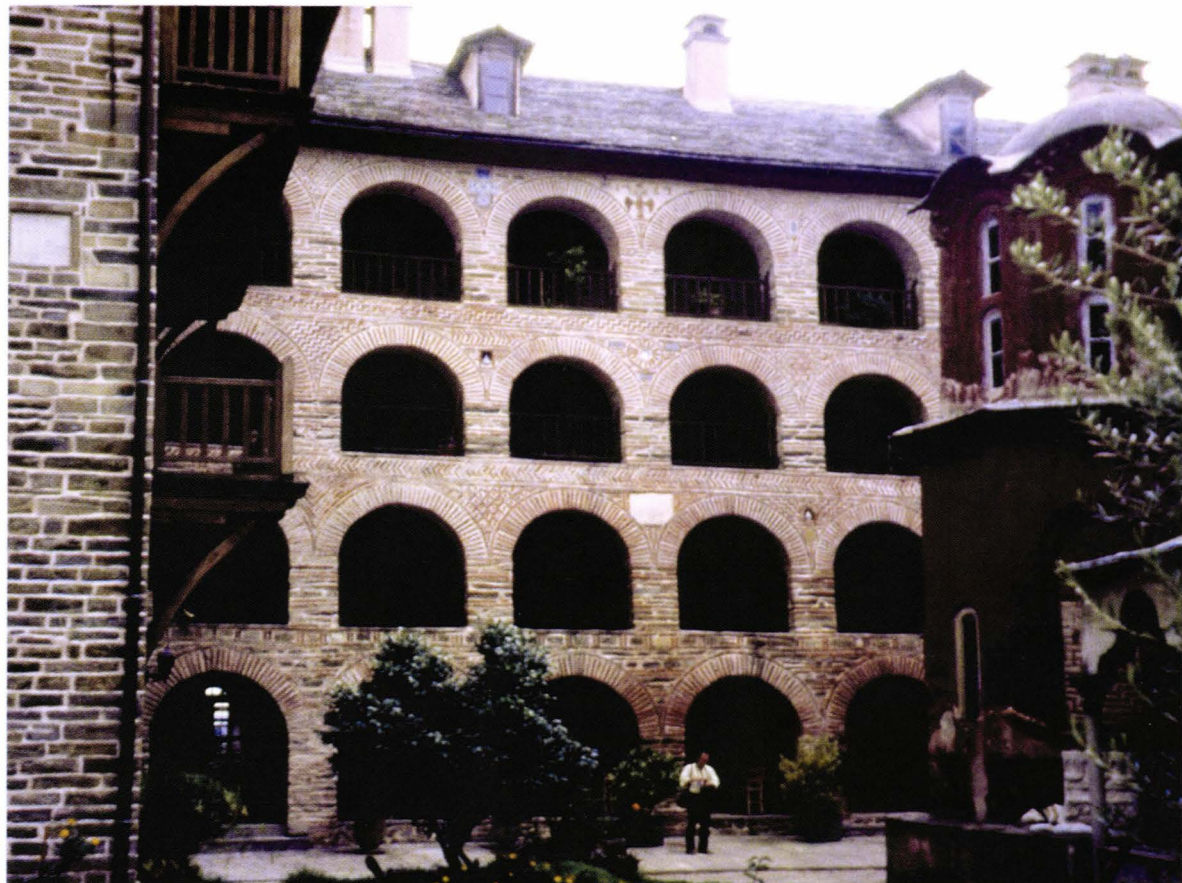
II. 9. Clădiri multi-etajate - (Koutloumousiou)