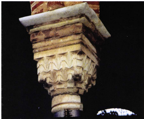
II. 12. Megas Lavras - fiala. Capitel en stalactite