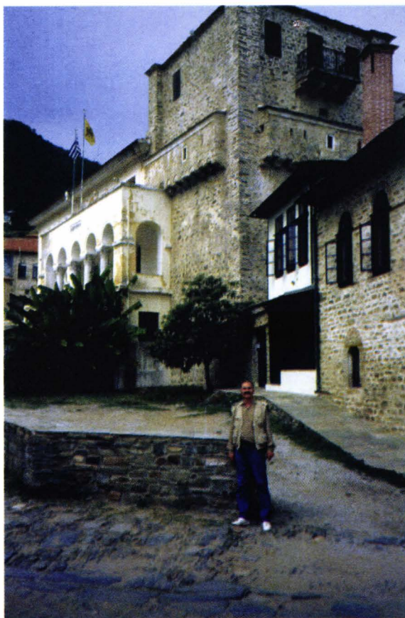
Π. 3. Karyes - sediul Sfintei Comunități (Iera Kinetita)