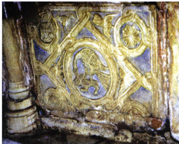
II. 13. Megas Lavras - fiala panou de parapet