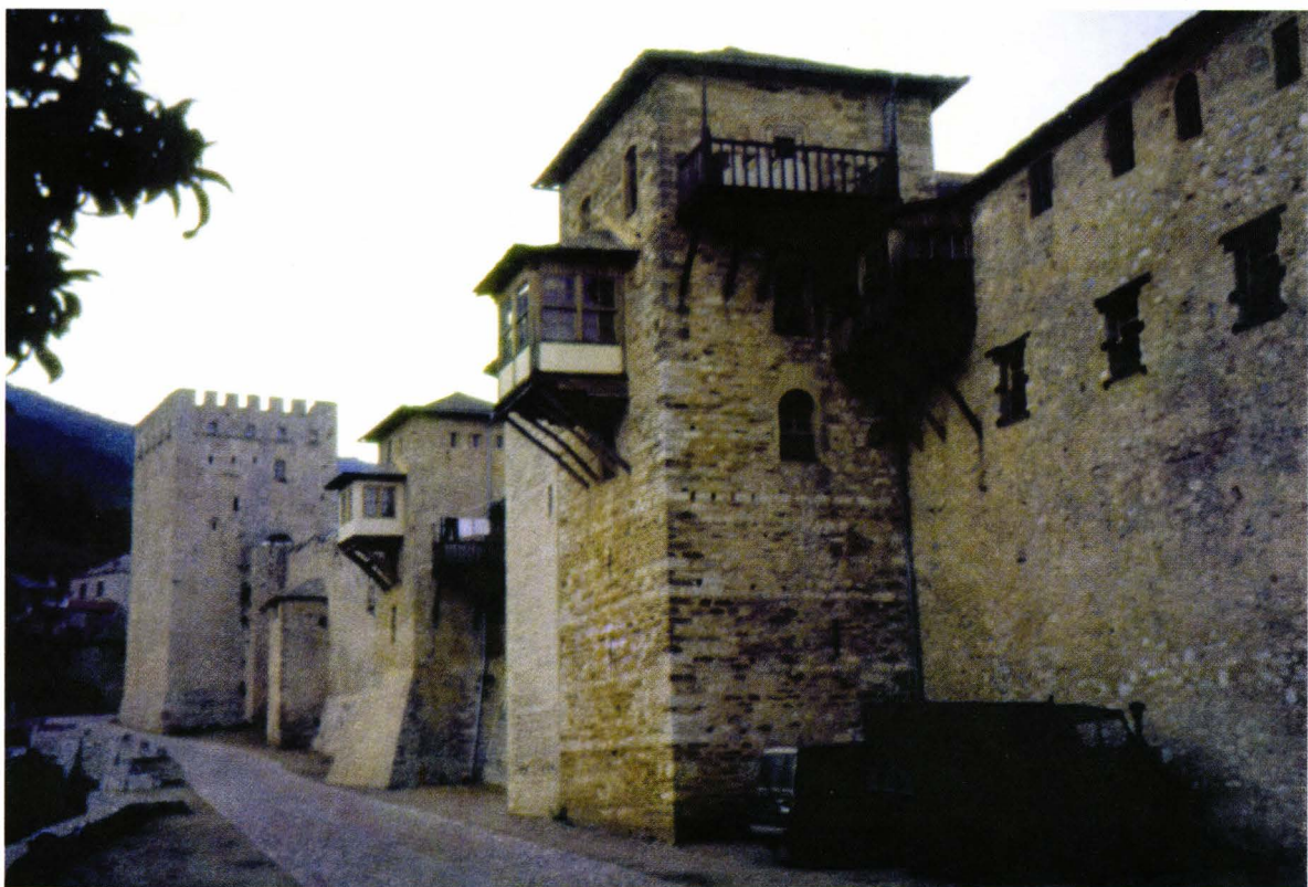
II. 5. Fortăreața Megas Lavras (în planul ultim, pîrgul)