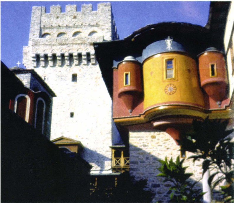
II. 17. Karakallou - pirgul