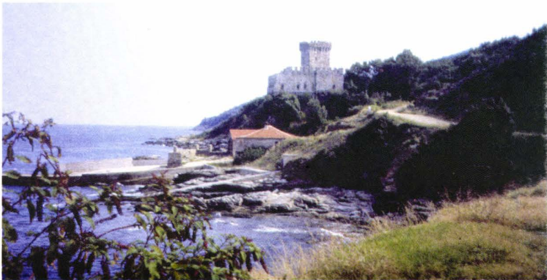
II. 18. Karakallou- arsana lui Petru Rareș