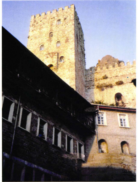
II. 21. Agiou Pavlou - pîrgul lui Neagoe Basarab