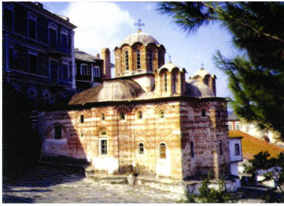
II. 22.. Vatopediou - paraclisul Sfântului Brâu (Neagoe Basarab)