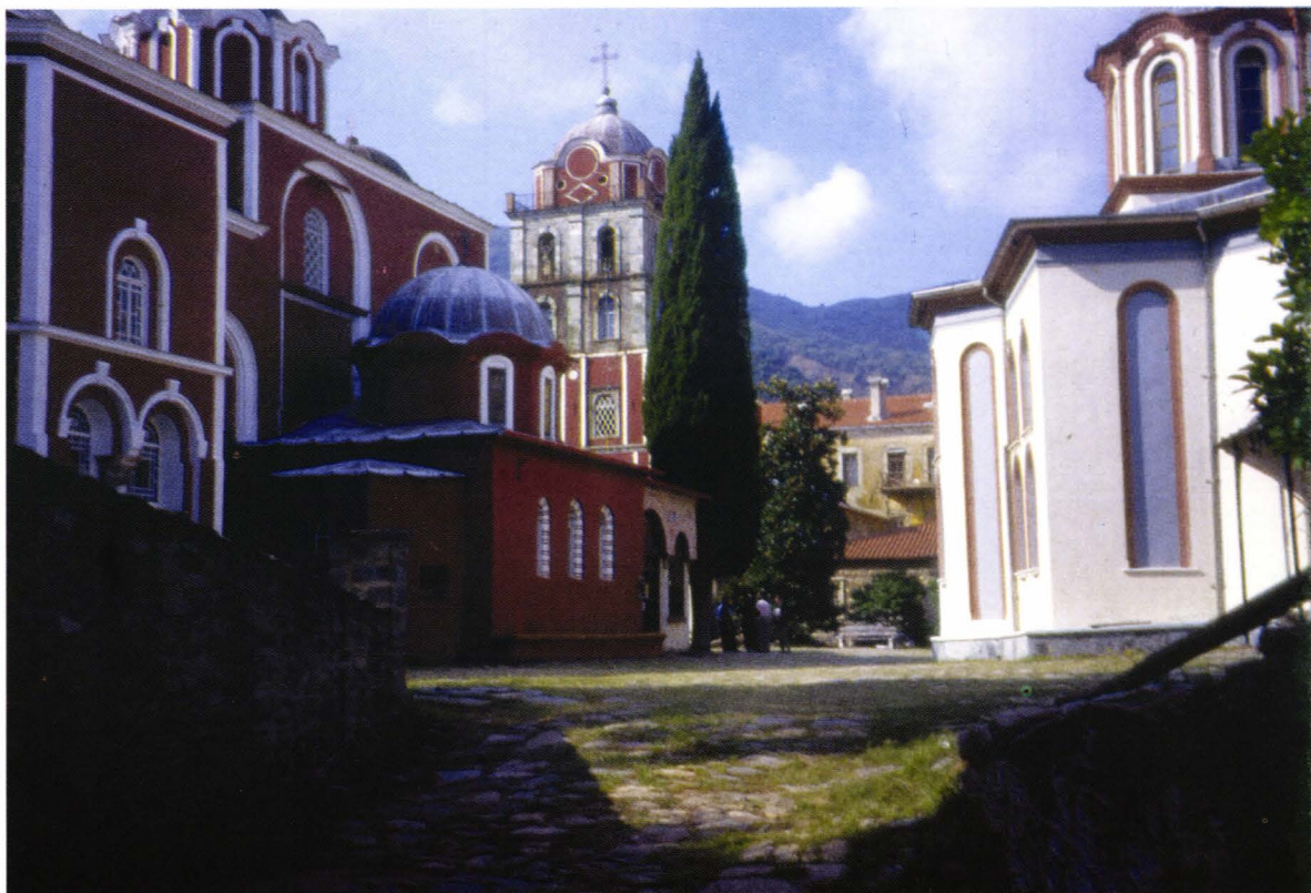
II. 8. Culori aprinse - (Ivion)