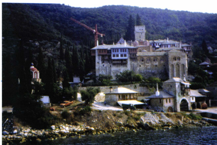
II. 15. Docheiariou