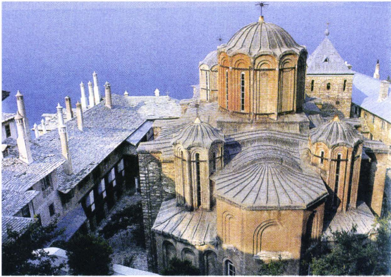
II. 16. Docheiariou - biserica lui Alexandru Lăpușneanu