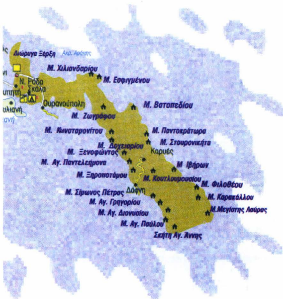
Π. 1. Sfântul Munte Athos – situarea mănăstirilor athonite