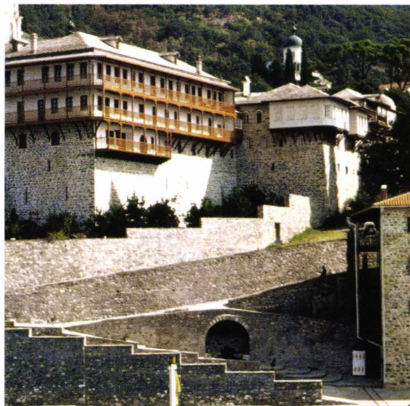
II. 10. Arhitectură vernaculară - (Agiou Panteleimonos-Russicon)