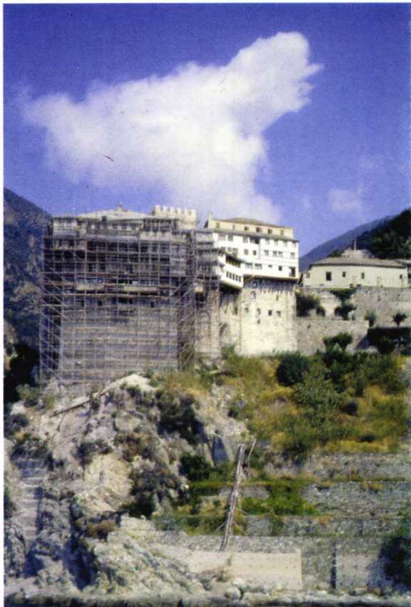
II. 7. Fortăreața Agiou Dionyssiou (unul din multele șantiere de restaurare).