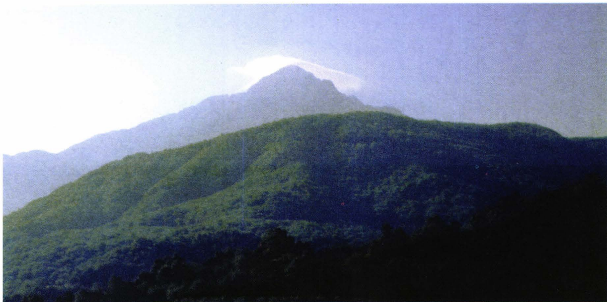
Π. 2. Muntele Aton văzut de la Karakallou