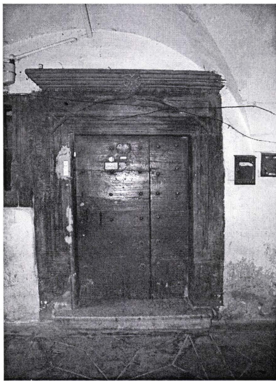
II. 7. Ancadrament de ușă, datat 1550 din casa din str. Mureșenilor 9