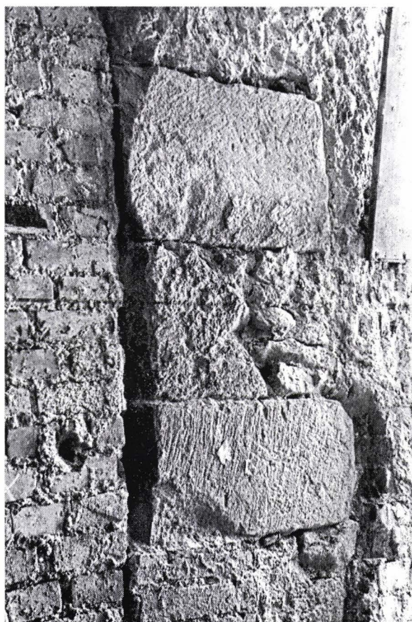
II. 13. Colț de clădire marcat cu blocuri de piatră fasonată în clădirea din Piața Sfatului 16