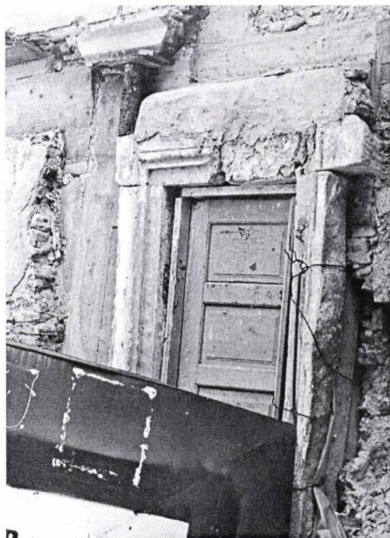
II. 6. Ancadrament de ușă din casa din Piața Sfatului 16