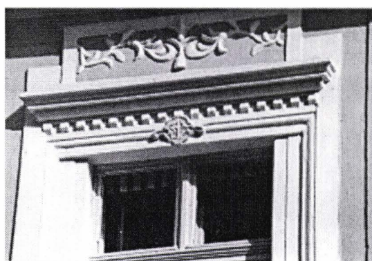
II. 11. Cornișe de ancadramenet din casa din str. Republicii 2