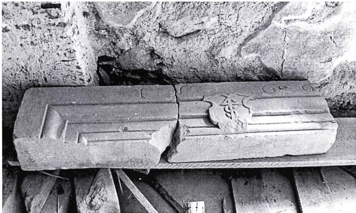
II. 5. Fragment de ancadrament de ușă, datat 1566, din casa din Piața Sfatului 16