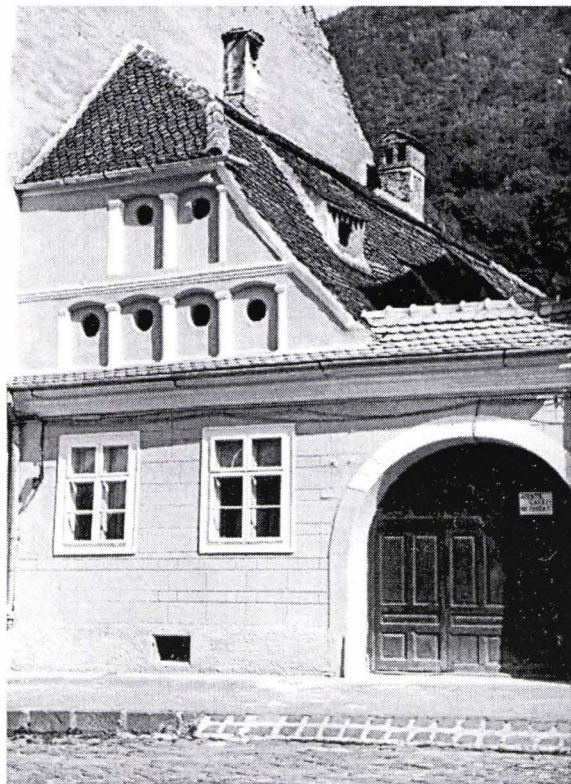
II. 3. Fațada casei din str. Castelului 42