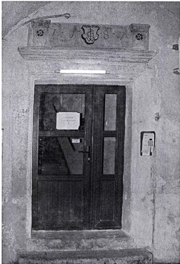
II. 9. Ancadrament în casa din Piața Sfatului 1