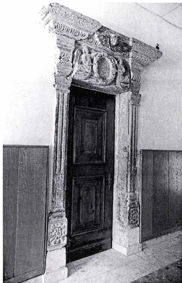
II. 10. Ancadrament din clădirea Liceului Johannes Honterus (Curtea Honterus 3), mutat aici din casa din Piața Sfatului 1