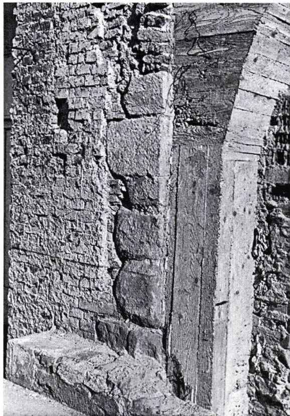
II. 12. Blocuri de piatră fasonată în clădirea din Piața Sfatului 15