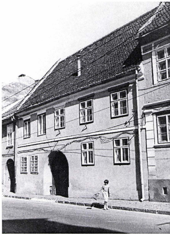
II. 1. Fațada casei din str. Poarta Schei 35