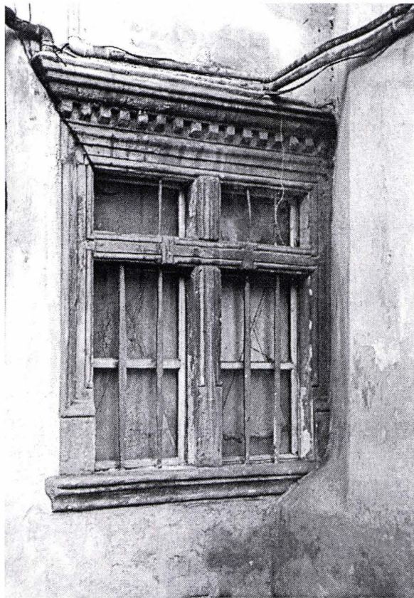
II. 8. Ancadrament de fereastră din casa din str. Mureșenilor 9