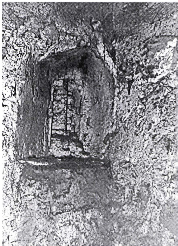
II. 4. Ferestruică în arc frânt din Piața Enescu 11B