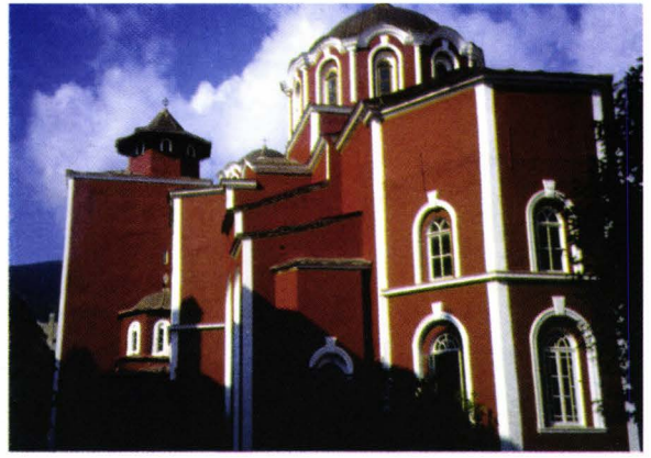
II. 23. Iviron- catoliconul (Radu Mihnea)