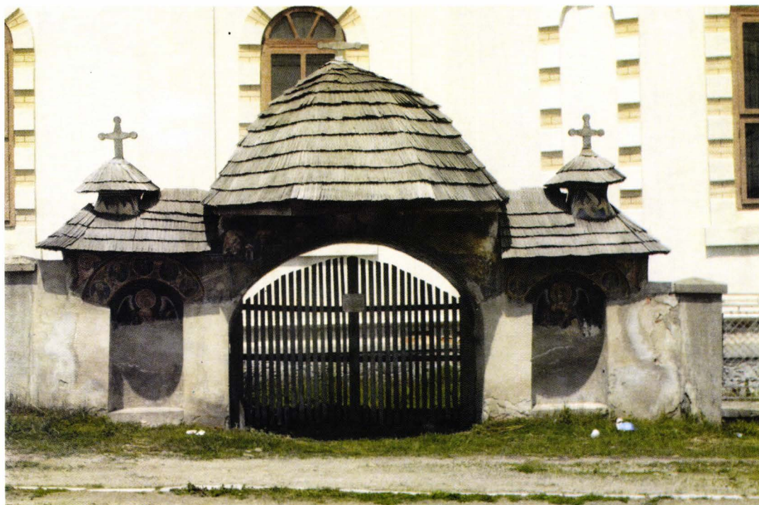
II. 12. Poarta de zid a bisericii vechi din Domneștii de Sus. Fațada sud. Foto 2006