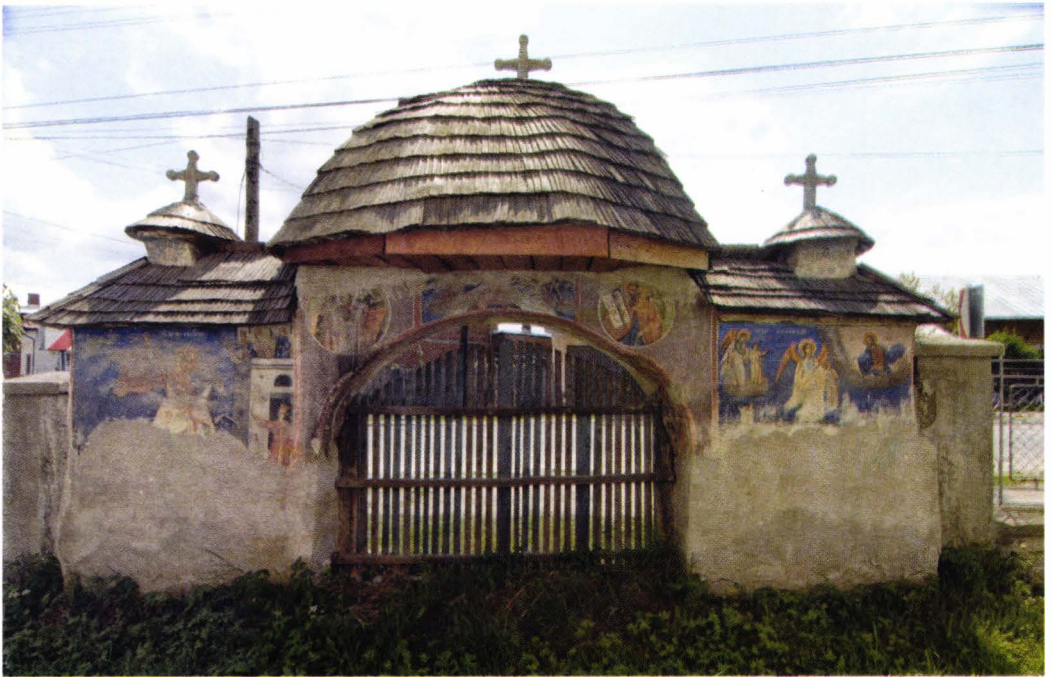
II. 14. Poarta de zid a bisericii vechi din Domneștii de Sus. Fațada nord. Foto 2006