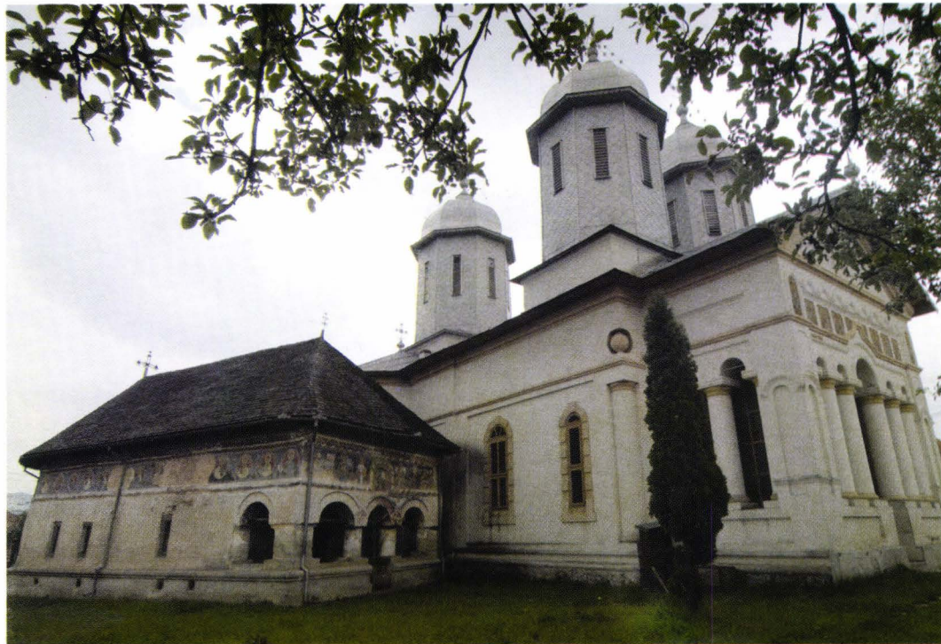
II. 11. Bisericile din Domneștii de Sus. Foto 2006