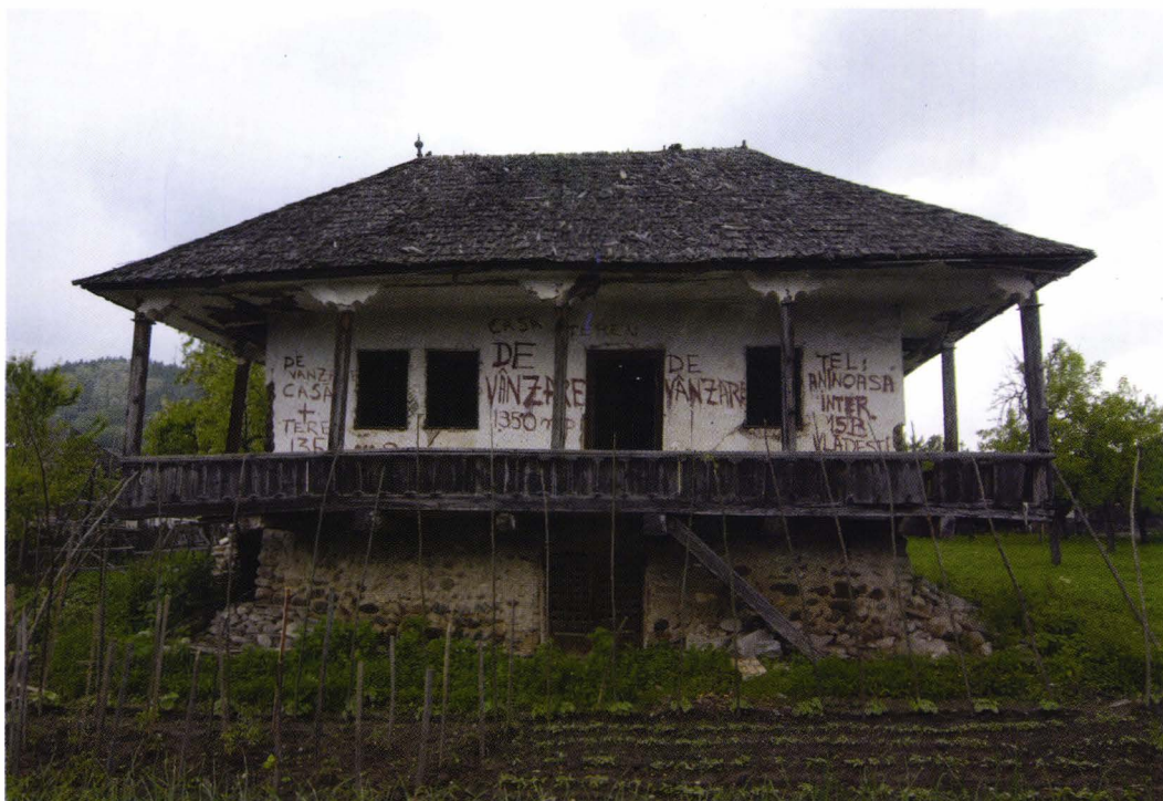
II. 10. Casa Felicia Proca din Domnești. Foto 2006