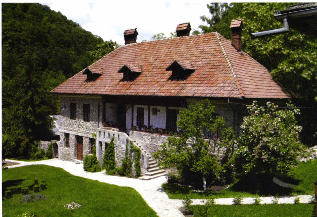
II. 8. Stăreția schitului Robaia, 1935. Foto 2008