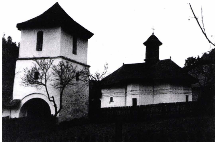
II. 1. Schitul Robaia. Fotografie din fișa de evidență DMI, 1965