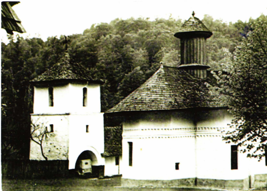
II. 5. Biserica și turnul clopotniță ale schitului Robaia. Fotografie din fișa de evidență DMI, 1965