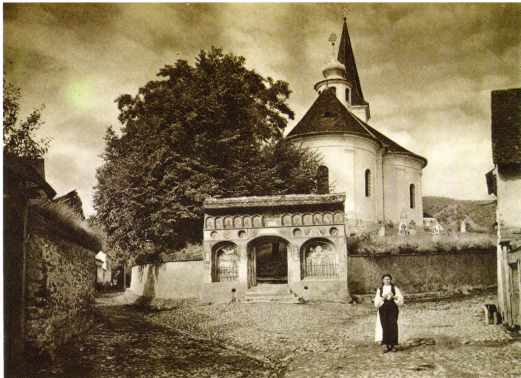
II. 15. Poarta de zid a bisericii din Boița, jud. Sibiu. După Kurt Hielscher, România , 1933