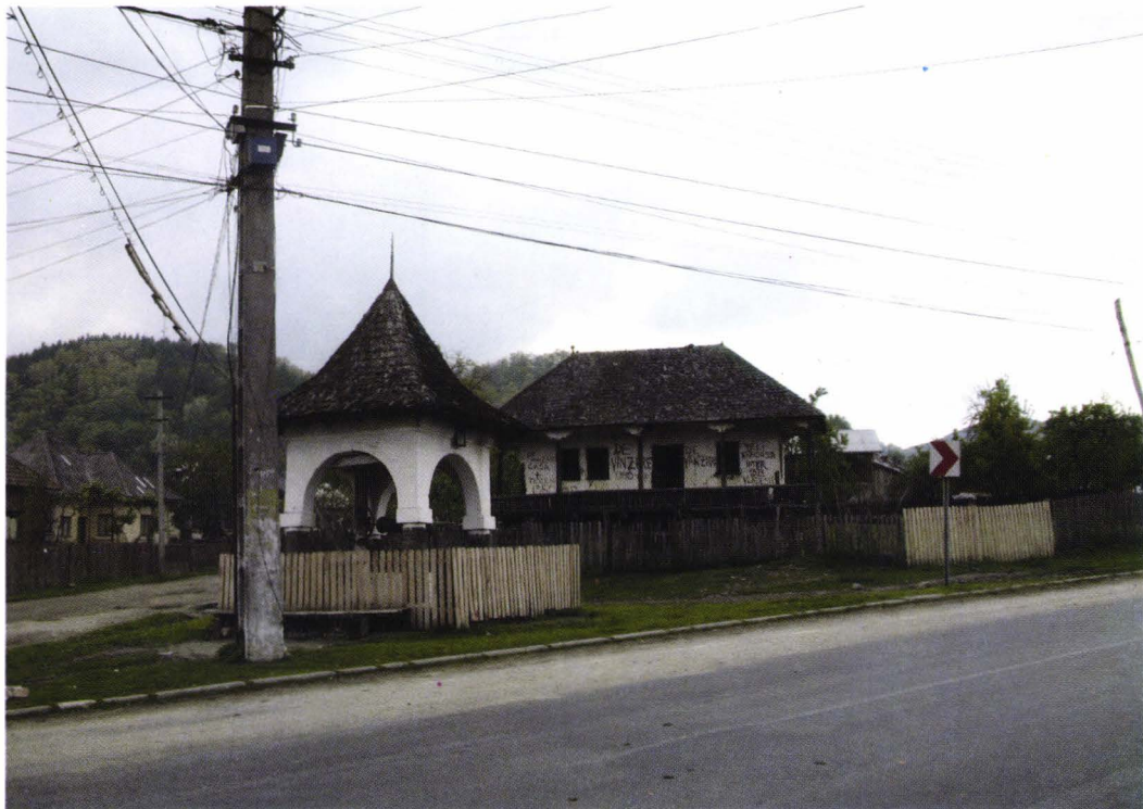
II. 9. Casa Felicia Proca și o fântână din Domnești, pe șoseaua Câmpulung-Curtea de Argeș. Foto 2006