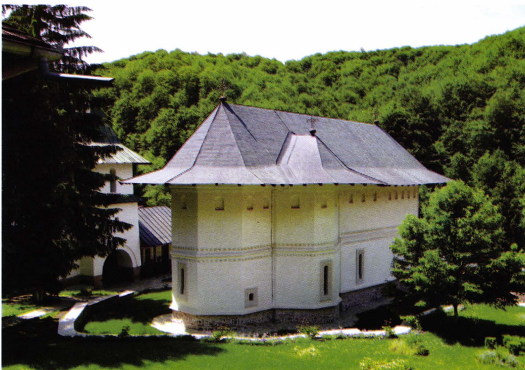
II. 6. Biserica și turnul clopotniță ale schitului Robaia. Foto 2008