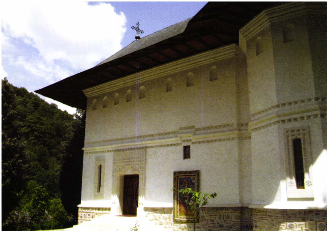
II. 7. Biserica schitului Robaia. Fațada sud. Foto 2008