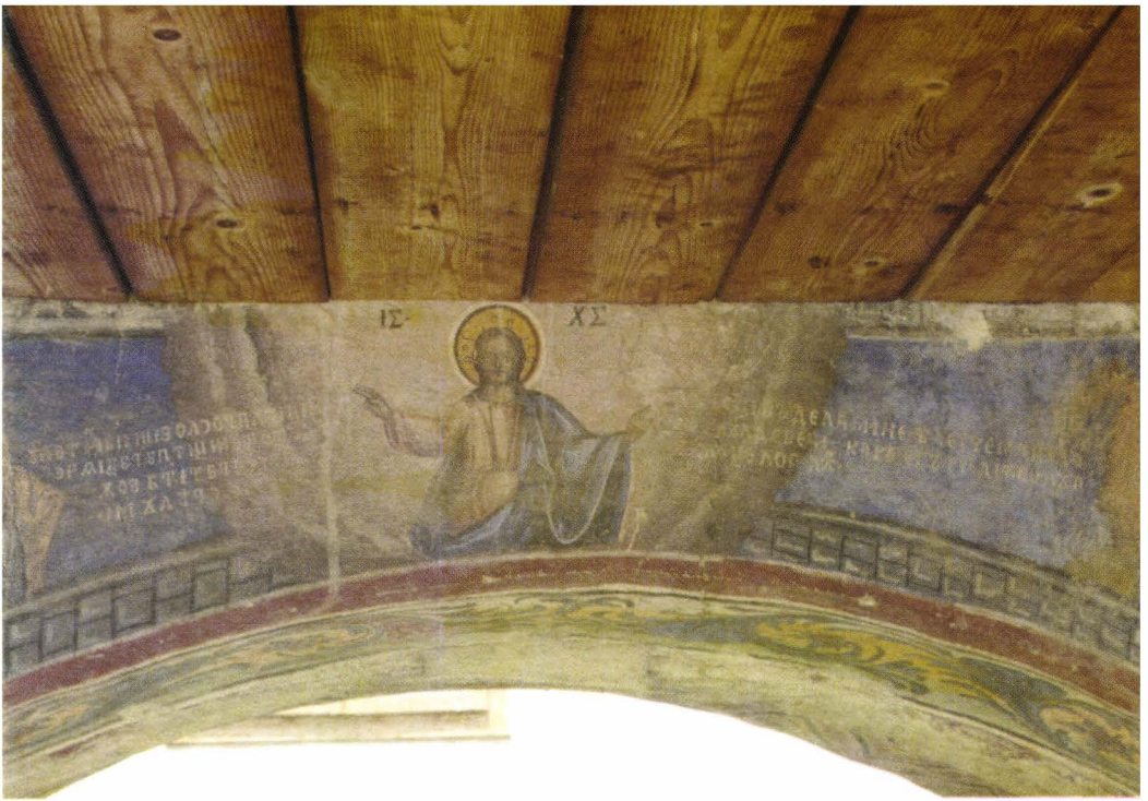
II. 13. Detaliu de pictură murală. Foto 2006