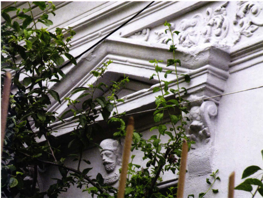
II. 3. Casa din Pitesti, str. Crinului, nr. 49, detaliu fatada cu portretul lui Mihai Viteazul