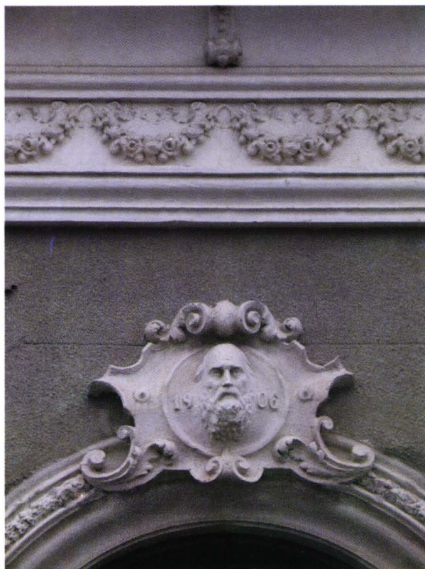
II. 2. Efigia regelui Carol I