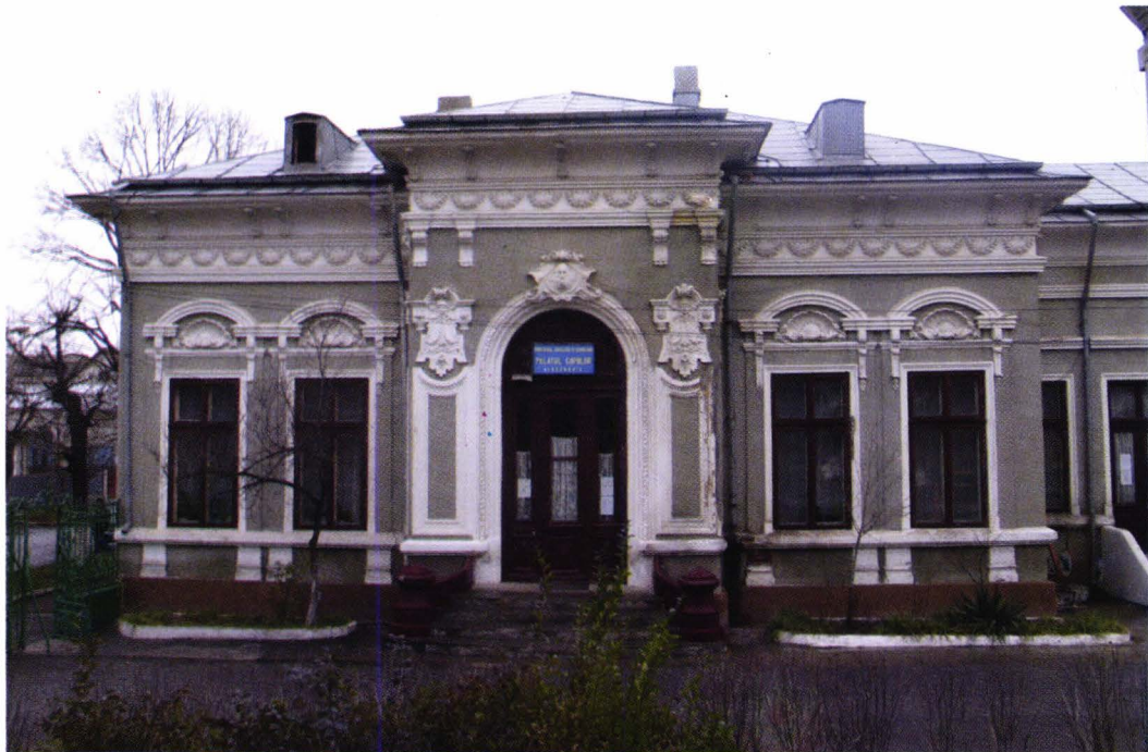
II. 1. Casa din Alexandria, str. Al. Colfescu, nr. 18