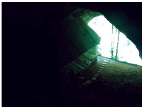
Fig. 1 Peștera Sântului Grigore Decapolitul de la Mănăstirea Bistrița

Cu trecerea timpului rolul de adăpost al peșterii crește devenind tot mai clar un adăpost bun pentru moaștele Sfântului Grigore Decapolitul precum și pentru oameni, cum este și în cazul mitropolitului Matei al Myrelor. Acesta, refugiat în 1610 de la Mănăstirea Dealul la Mănăstirea Bistrița, fiind constrâns de dese atacuri în Țara Românească ale principelui transilvănean Gabriel Bathory (1608-1613), menționează în cronică sa Mănăstirea Bistrița și peștera de aici, adăugând despre aceasta din urmă că: “ de frică