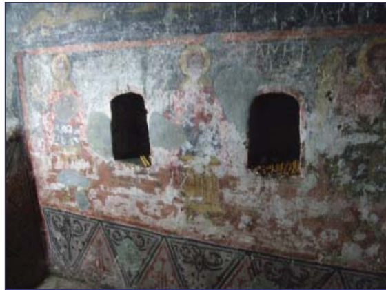
Fig. 7 Exemplu de ornamentare a peretilor bisericii cu modele geometrico-florale

Absida altarului de formă neregulată, este realizată de asemenea prin săparea stâncii. Partea centrală, semicirculară, precum și latura sudică a bisericii sunt realizate din cărămidă. Pe emiciclu, în absida altarului este reprezentat Iisus în mormânt înconjurat de o serie de sfinți, printre care, Sfântul Spiridon, pe latura de nord și de Ioan Evanghelistul, Dreptul Simenon, Atanasie cel Mare, Eftimie cel Mare, Ioan Gură de Aur, Grigorie Teologul, Vasile cel Mare și Ierarhul Nicolae, pe latura de sud.