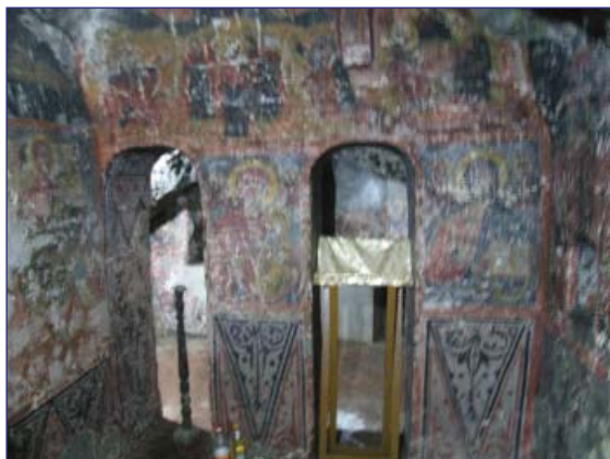
Fig.3 Tâmpla Bisericii Ovidenia