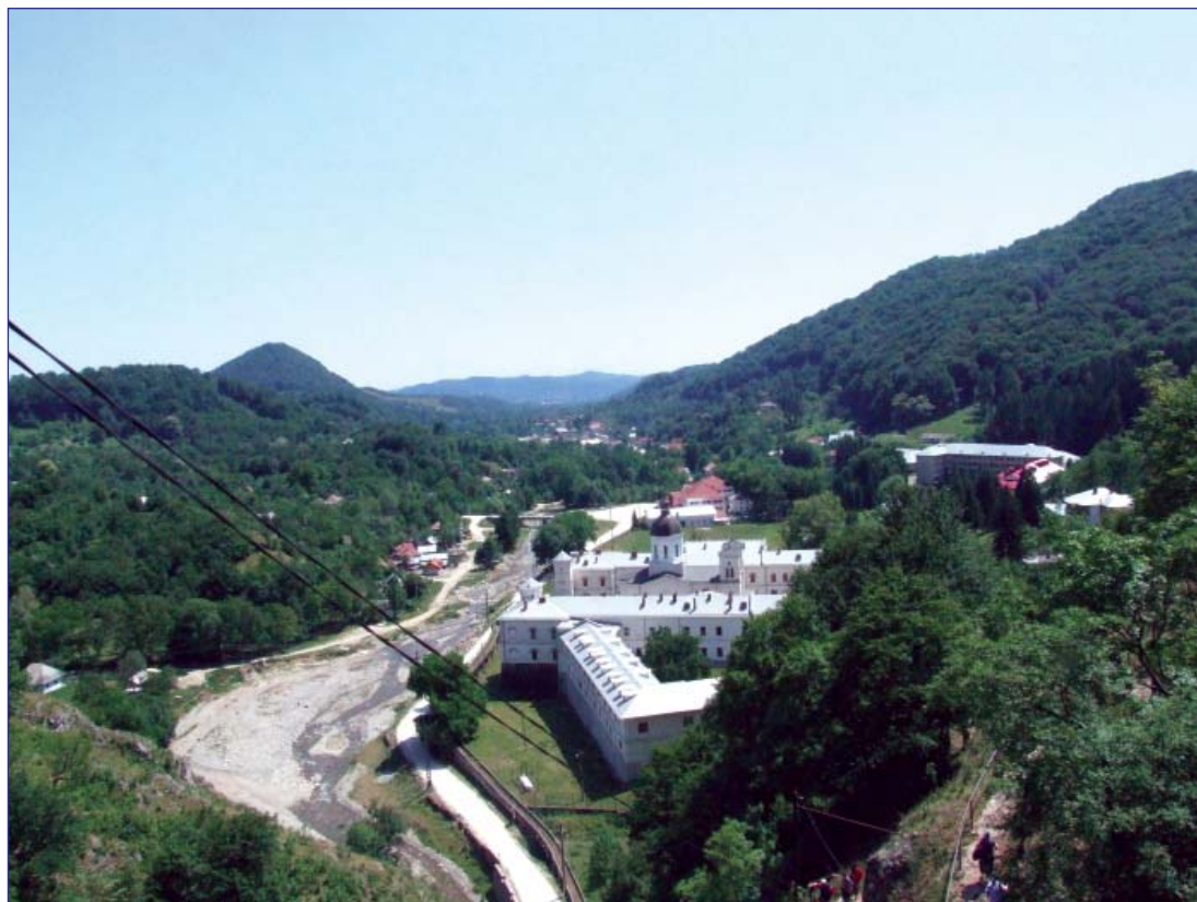
Fig. 2. Biserica cu hramul Sfinții Arhangheli

sau, mai bine, de prigoane, părinții Mănăstirii adusesse Moaștele în Peștera în care eram și noi” 5 . Astfel, mitropolitul Matei al Myrelor devine primul cronicar bisericesc care menționează peștera ca pe un loc propice de adăpost împotriva atacatorilor.