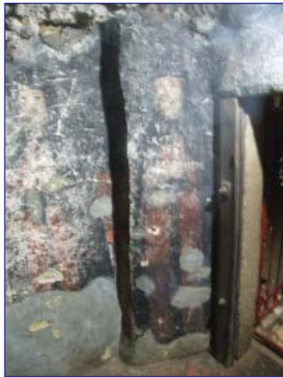
Fig. 6 Macarie și ieromonahul Daniil