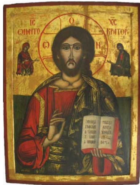
Fig. 4 – Icoană de hram „Soborul Apostolilor” Fig. 5 – Icoană împărătească „Iisus Hristos Pantocrator”

Din inventarul de bunuri al acestei biserici, îndelung încercat de tribulațiile sorții monumentului, s-au păstrat trei icoane remarcabile, atât prin vechime, ele datând din anul zidirii, cât și prin valoarea lor artistică.