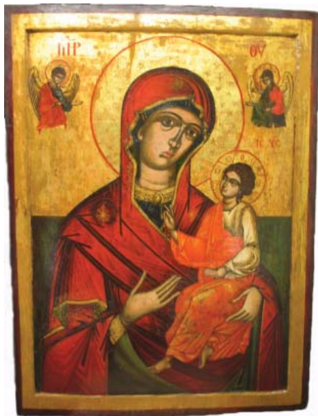
Fig. 6 – Icoană împărătească „Maica Domnului cu Pruncul”

stânga ține Evanghelia deschisă. În dreapta și stânga este încadrat de sfinții intercesori, Fecioara Maria și Ioan Botezătorul.