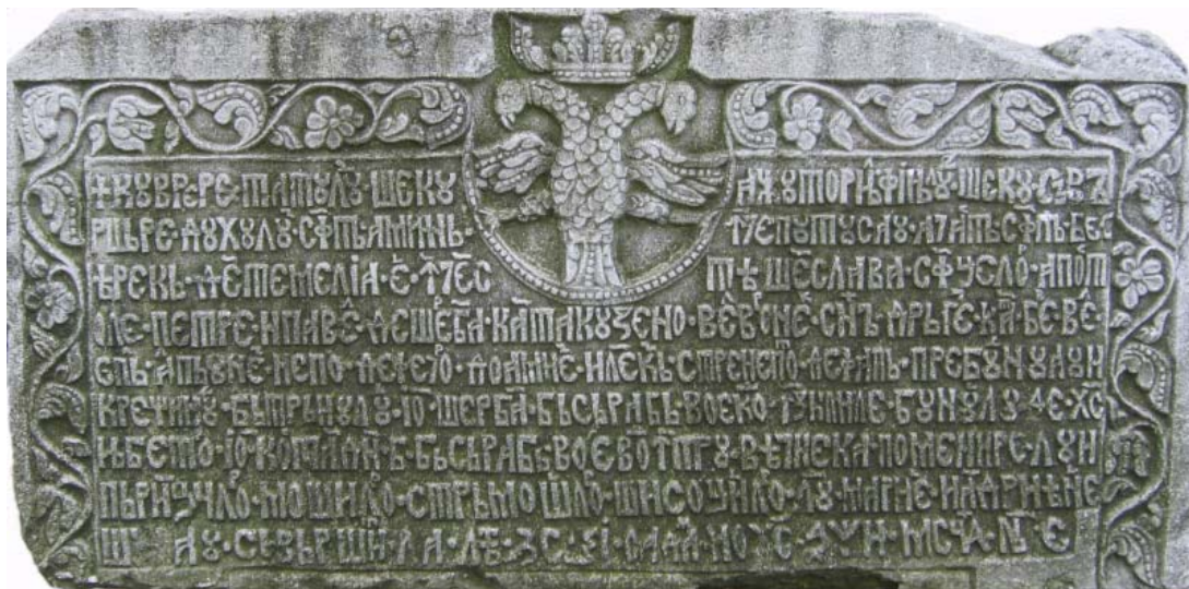
Fig. 1 – Pisania Bisericii „Sf. Apostoli” din anul 1708

Alexandru Scarlat Ghica emite hrisovul prin care înzestrează mănăstirea „Sf. Spiridon”, recent înființată, cu toată moșia domnească din Ruși și îi închină și biserica, ctitorie Cantacuzină 6 , se va declanșa o lungă luptă de rezistență a târgoveților, deveniți clăcași, împotriva actului de danie și pretențiilor noului proprietar.