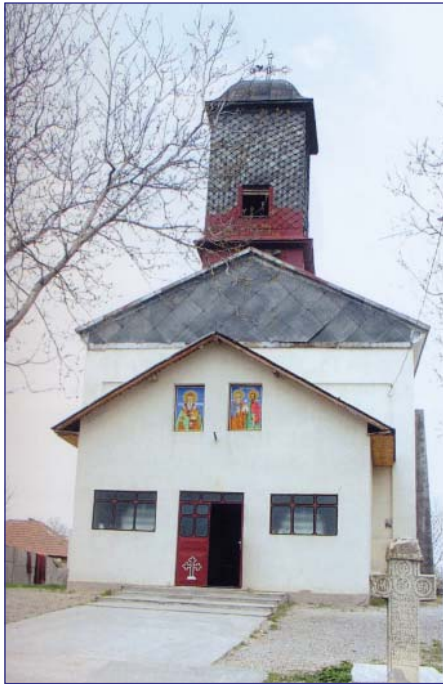
Fig. 2 - Biserica „Sf. Spiridon” astăzi