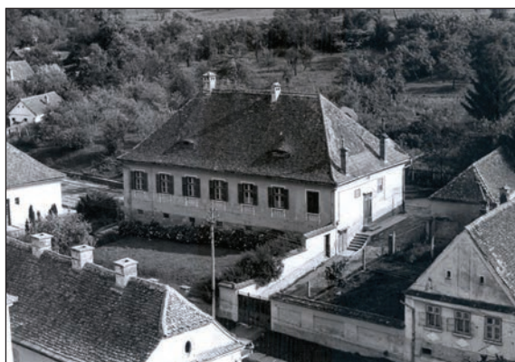
Fig. 9 Casa parohială evanghelică / Maison paroissiale évangélique