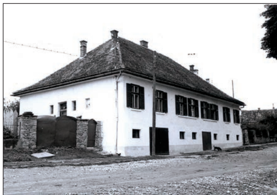
Fig. 10 Casa predicatorilor / Maison des instituteurs de l'école confessionnelle