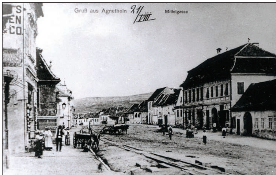
Fig. 26 Mittelgasse (str. 1 Decembrie) (vedere istorică) / Ancienne vue de la Rue de 1 er Décembre (à l'époque Mittelgasse)

mânesc a avut și grădiniță ce funcționa, se pare, într-o casă închiriată pe str. Plevna.