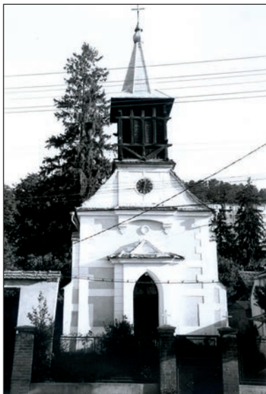
Fig. 23 Biserica romano-catolică / L'église romano-catholique

O clădire de folosință publică rar întâlnită în spațiul rural este spitalul (folosit și ca azil, spital pentru boli contagioase). Se află la limita vestică a