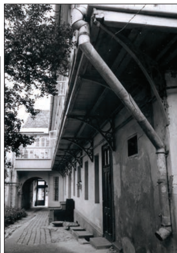
Fig. 28 Galerie la casa de pe str. 1 Decembrie, Nr. 1 / Maison – 1, Rue 1 er Décembre; détail de la coursive