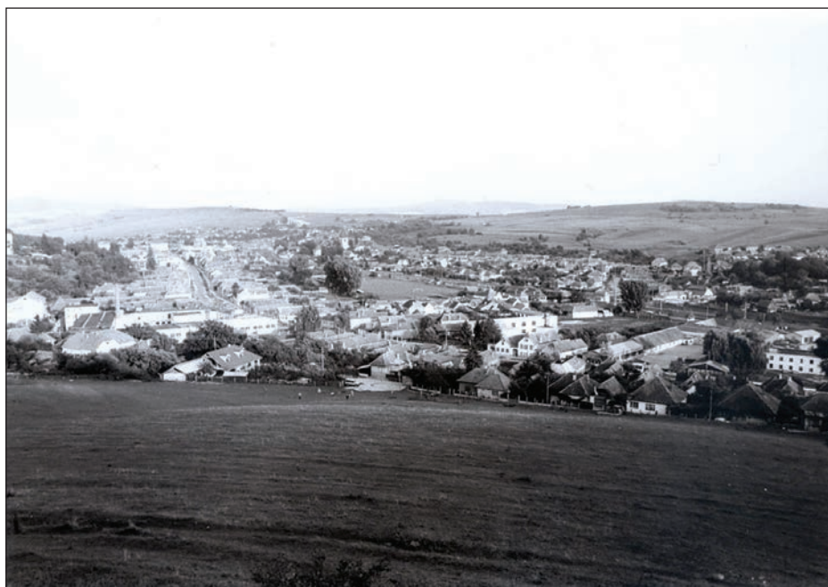
Fig. 1 Imagine a localității (dinspre NV) / Vue d'ensemble de la localité (prise depuis le nord-ouest)

Direcțiile de dezvoltare ale așezării au fost determinate de prezența teraselor aflate de-a lungul văii Hârtibaciului și a unora din afluenții acestuia, ca și de pantele abrupte care mărginesc aceste terase. Partea nordică a localității istorice a avut ca limite de dezvoltare, spre nord, pantele abrupte ale Steinburg-ului, iar spre est, respectiv spre vest pâraiele Grodenbach și