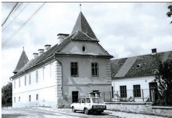
Fig. 6 Vechea școală confesională evanghelică / L'ancienne école confessionnelle évangélique

La începutul sec. XX, conform hărții funciare întocmită la 1901, localitatea se întindea spre est până la fosta întreprindere „IMIX” (str. Avram Iancu 66), iar pe malul stâng până la str. Plevnei-Auf dem Hill – unde nu existau decât câteva gospodării, în partea de jos a pantei. Spre vest, pe malul drept, limita era Schlossbach (și locul târgului de vite), iar pe malul stâng piața triumfiulară, aflată între malul Hârțibaciului și capătul vestic al str. Aurel Vlaicu-Obergasse. Spre nord, pe str. Horea-Grodengasse, ultimele gospodării se aflau la capătul actualei străzi Horea, iar pe str. Fabricii-