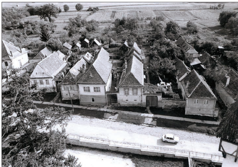
Fig. 30 Front de gospodăriei pe str. Nouă (nr. 4, dreapta-12, stânga) / Maisons sur la rue Nouă, du numéro 4 (à droite) au numéro 12 (à gauche)