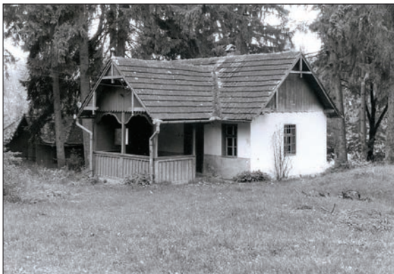
Fig. 17 Casă de vacanță la Sărături (Salzbrunnen) / Maison de vacances à Sărături

starea actuală a clădirilor și cea înfățișată de imagini ale orașului din a doua jumătate a sec. XIX - începutul sec. XX.