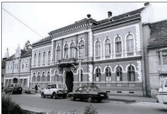
Fig. 11 "Noua" primărie / Mairie bâtie en 1885, appelée la „nouvelle” mairie

O altă intervenție radicală în aspectul istoric al orașului, deja menționată, a fost, instalarea liniei înguste de-a lungul străzilor principale de pe malul drept al Hârtibaciului. Mocănița a intrat în imaginea Agnitei,