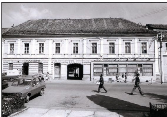
Fig. 12 Fostul hotel comunal "Agneta" / Ancien hôtel communal "Agneta"

devenind un simbol al acesteia, încât desființarea sa a fost și este percepută ca o pierdere în aspectul istoric al orașului.