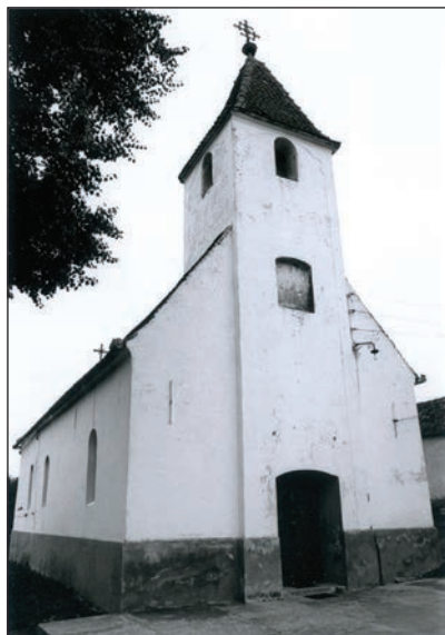
Fig. 19 Biserica ortodoxă veche / Ancienne église orthodoxe