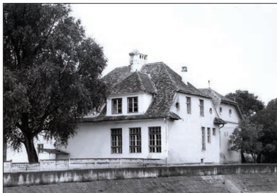
Fig. 8 Sala Societății de gimnastică (Turnsaal) / La salle de la Société de gymnastique (Turnsaal)

În cartierul săsesc parcelele istorice aveau suprafețe aproximativ egale – lungimile și lățimile fiind determinate de formele de relief cărora trebuiau să se adapteze. În zona centrală (nucleul istoric) predomină parcelele înguste (10-12 m) și lungi (lungimile inițiale au fost modificate de evoluția postbelică a orașului). Cartierul românesc avea același sistem de parcelare – șiruri compacte de parcele cu suprafețe