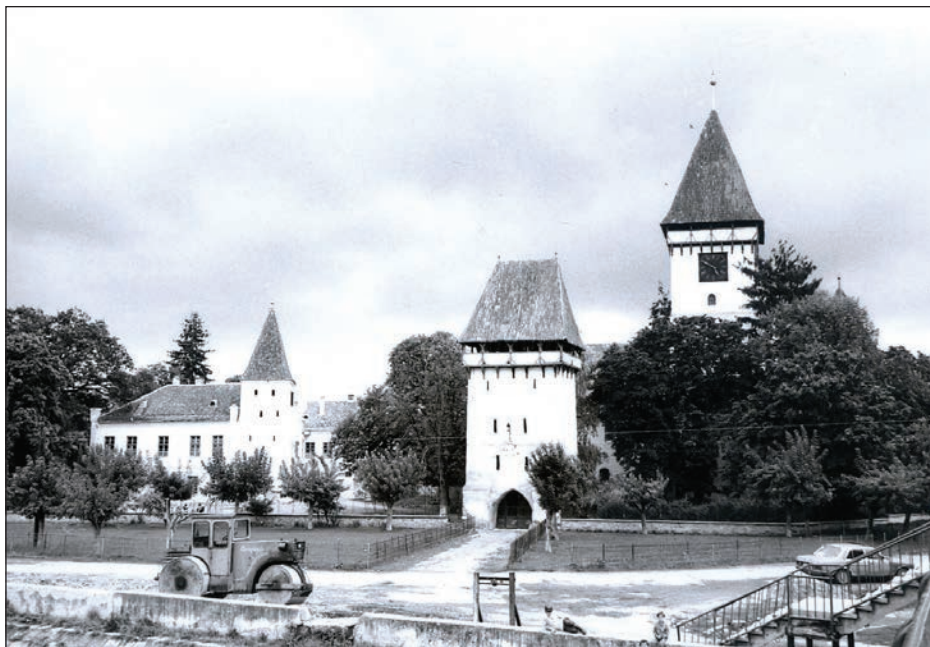
Fig. 5 Ansamblul bisericii evanghelice (dinspre N) / Vue d'ensemble de l'église évangélique (du côté de nord)

doua jumătate a sec. XIX, în legătură cu funcțiile administrative zonale ale localității 23 , și s-a stabilit preponderent în partea de vest a cartierului săsesc.