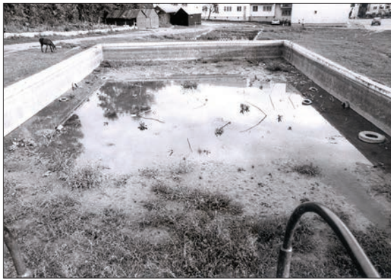
Fig. 16 Fostul bazin de înot / L'ancienne piscine communale