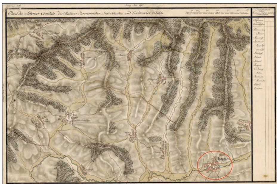
Fig. 32 Harta Ridicarea Josefină - cu planul Agnitei

Populația maghiară a apărut în număr mai mare în Agnita în a