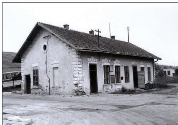
Fig. 25 Fosta gară a mocăniței / Ancienne gare du train local à voie étroite

parohială ortodoxă (Fig. 20), construită la 1904; se distinge de locuințele cartierului atât prin amploare cât și prin decorația de inspirație neoromânească, unică în localitate. Ea a fost construită pe locul unei case parohiale și a unei școli confesionale ortodoxe ce funcționau, deja, la sfârșitul sec. XVIII (1784) 28 . Casa parohială ortodoxă adăpostește și muzeul protopopiatului ortodox din zonă. Cartierul ro-