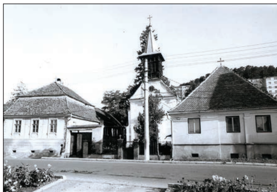
Fig. 24 Casa parohială romano-catolică (stânga) și casa curatorului (dreapta) / Maison paroissiale romano-catholique (à gauche) et maison du soign- ant de l'église romano-catholique (à droite)

cartierului săsesc, pe strada Fabricii nr. 4 (Fig. 14). Este o locuință datată 1819, tipică pentru clădirile mai dezvoltate de la sfârșitul sec. XVIII-începutul sec. XIX în localitate și zonă, din punct de vedere al planului și structurii. A fost cumpărată de comunitate la sfârșitul sec. XIX și extinsă în 1936. Este importantă și pentru documentarea modului de a percepe îngrijirea sănătății și protecția socială în comunitate la sfârșitul sec. XIX - începutul sec. XX.