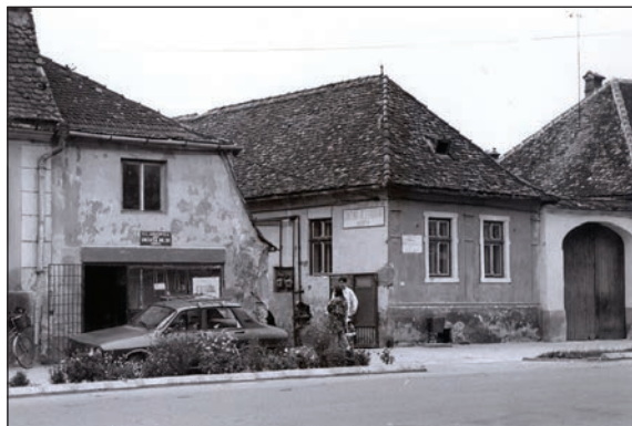
Fig. 13 Locuința îngrijitorului fostelor grajduri comunale / Logement de la personne en charge des anciennes étables communales

ca și clădirile industriale modernizate aflate în apropierea Pieții Republicii: noua Fabrică de ciorapi (care a făcut să dispară trei clădiri databile la mijlocul sec. XIX, specifice ca model clădirilor dezvoltate ale zonei în acea perioadă) și noua tăbăcărie minerală. O altă schimbare care a sărăcit aspectul istoric al orașului a fost modificarea tipurilor de vitrine: vitrinele cu ancadrame din lemn, bogat profilate și decorate cu elemente arhitectonice (pilaștri, denticuli) au fost înlocuite cu vitrine cu tâmplărie metalică și mari suprafețe vitrate. Au fost, de asemenea, desființate decorațiile clasice