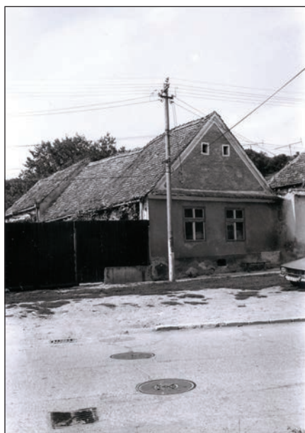
Fig. 14 Fostul spital / L'ancien hôpital

Aceste modificări au fost evidențiate atât de cercetările din timpul inventarierii, cât și de comparațiile între