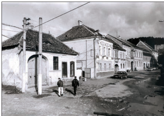
Fig. 31 Piața – latura de V / Place de la République – côté ouest

apartținând primei etape de constituire a nucleului istoric: Obergasse-str. Aurel Vlaicu. Agnita avea un hinterland vast, unul dintre cele mai extinse teritorii din zonă.