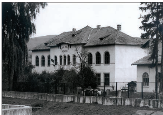
Fig. 22 Fosta școală de stat / Ancienne école d'Etat

Lângă Primărie, pe str. Mihai Viteazul nr. 18, se află fosta clădire a vecinătăților care, ca funcție, nu-și găsește echivalent în comunele din jur, dar ale cărei siluetă și plan sunt similare