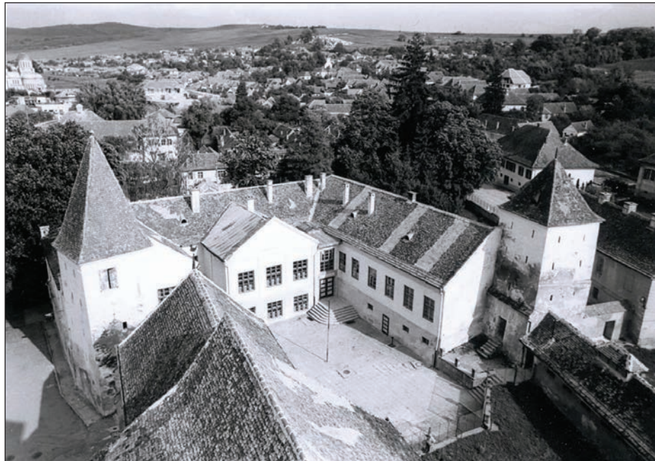
Fig. 7 Noua școală confesională evanghelică / La nouvelle école confessionnelle évangélique

Într-o hartă din 1929, aflată în posesiunea primăriei, limita localității din 1901 fusese deja depășită spre est (circa 15 clădiri), era schițată extinderea pe actuala stradă Grădinilor, spre nord începuse dezvoltarea