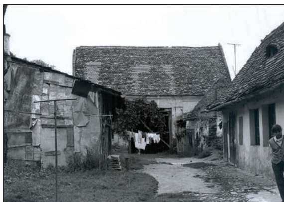
Fig. 29 Șura gospodăriei de pe str. 1 Decembrie, Nr. 33 / Grange de la ferme située au No 33, Rue 1 er Décembre

În 1897, concomitent cu linia ferată îngustă, au apărut, pe teritoriul localității, clădiri și spații legate de aceasta: una din încăperile aflate la parterul Hotelului comunal adăpostea casa de bilete, iar la extremitatea estică a str. Avram Iancu (Weihergasse) a fost construită gara cu depou și locuință pentru funcționari. Din acest complex se mai păstrează în prezent doar gara – clădire tip, parter, cu latura lungă la stradă, cu elemente decorative clasicizante simplificate (Fig. 25).