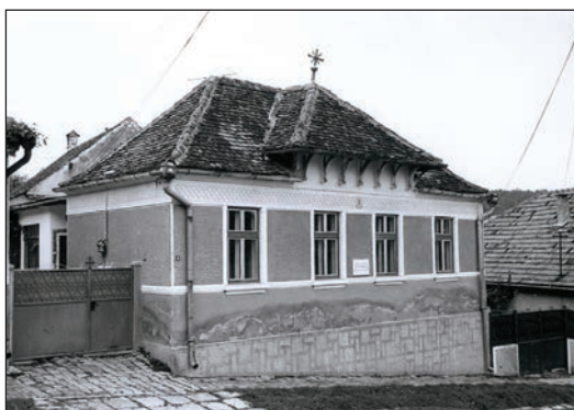
Fig. 20 Casa parohială ortodoxă / Maison paroissiale orthodoxe