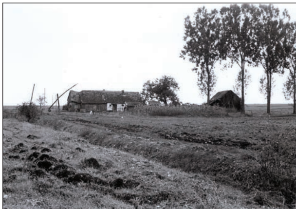
Fig. 2 Gospodărie de hotar, spre Vărd / Ferme dans les champs, vers le village de Vărd

În decursul existenței sale Agnita a polarizat viața economică a zonei, datorită dezvoltării meșteșugarilor și comerțului într-o proporție neobișnuită pentru o localitate rurală. Existența timpurie și dezvoltarea breslelor este ilustrată nu numai de atestarea documentară menționată mai sus ci și de faptul că întreținerea și apărarea turnurilor incintei fortificate a bisericii evanghelice au fost încredințate, încă de la început, acestora 9 : turnul de nord – al porții – era al breslei dogarilor, cel de pe vestul bisericii era al olarilor, cel sud-vestic al cizmarilor, cel sud-estic al croitorilor și blănarilor, iar cel estic al bres-