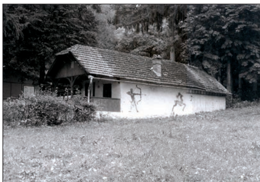
Fig. 18 Casă de vacanță la Sărături (Salzbrunnen) / Maison de vacances à Sărături

La 1900, la est de biserică și școală, a fost construită clădirea cu un nivel și bogată decorație clasicizantă a Societății de gimnastică și, în legătură cu aceasta, clădirea grădiniței germane (Fig. 8).