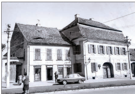
Fig. 27 Muzeul Văii Hârtibaciului (dreapta) / Musée de la Vallée de Hârtibaciu (à droite)

În imediata apropiere a bisericii, la vest, respectiv est, se află casa parohială și casa curatorului (Fig. 24), amenajate în două case preexistente, ambele databile sfârșitul sec. XVIII - începutul sec. XIX, cu plan compact și siluetă specifică pentru epocă în localitate și zonă; ele au suferit extinderi și modificări pe la mijlocul sec. XIX (probabil în momentul schimbării destinației). În filă cu fosta casă parohială