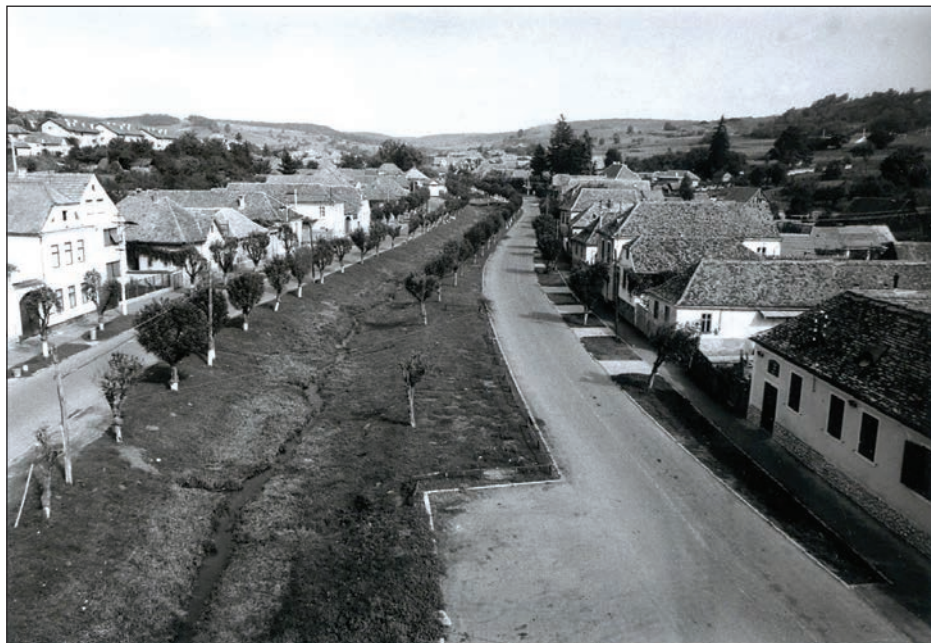
Fig. 4 Strada Horea (Grodengasse) / Rue Horea (Grodengasse)

istoric al cartierului, format cu precădere pe malul drept al râului, și etapa de colonizare secundară 21 , când cartierul s-a extins spre est de nucleul istoric. Nucleul istoric al cartierului săsesc avea ca punct de greutate Piața (Marktplatz), amplu spațiu dreptunghiular, care se întindea pe ambele maluri ale râului. În partea de sud a acestui spațiu se afla biserica, în cea nordică locul de târg, iar din colțurile de nord-est, nord-vest, respectiv sud-vest ale acesteia porneau cele trei străzi ale cartierului: Mittelgasse (str. 1 Decembrie), Niedergasse (str. Mihai Viteazul), Obergasse (str. Aurel Vlaicu). În cursul celei de-a doua etape au apărut ulițele Neugasse (str. Nouă), Weihergasse (str. Avram Iancu), Grodengasse (str. Horea). Direcția principală de dezvoltare a cartierului a fost de-a lungul văii Hârtibaciului, dezvoltarea mai accentuată spre nord față de sud fiind datorată prezenței drumului comercial, spațiului de construcție oferit de terasele pâraielor din zona menționată (Grodembach) și, într-o oarecare măsură, datorită stabilirii, în zona de nord a Agnitei, a atelierelor meșteșugărești și, mai apoi, a industriilor orașului. La sfârșitul perioadei interbelice cartierul săsesc cuprindea str. Aurel Vlaicu (Obergasse), str. Nouă (Neugasse), str. Plevna (Auf dem Hill), str. Horea (Grodengasse) (Fig. 4), str. Avram Iancu (Weihergasse), str. 1 Decembrie (Mittelgasse), str. Mihai Viteazul (Niedergasse), str.