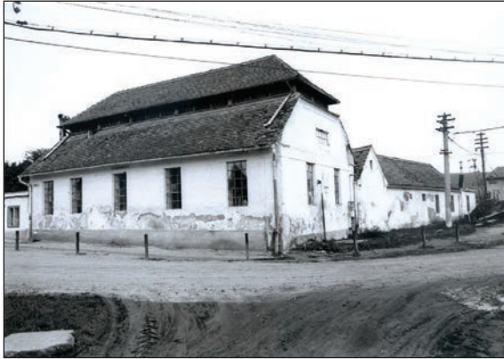
Fig. 15 Fostul abator / L'ancien abattoir