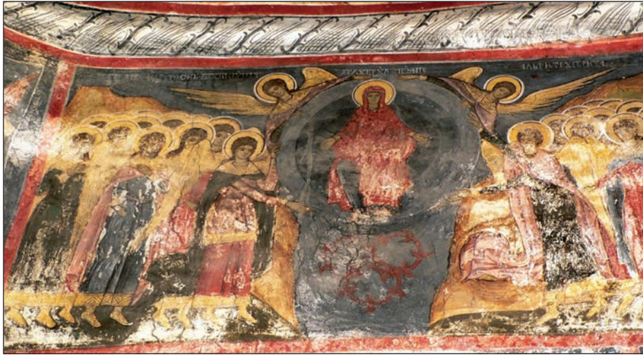
Fig. 7. Pilda talanților. În stânga scenei, reprezentarea stareței Căzănescu, păstrată parțial.