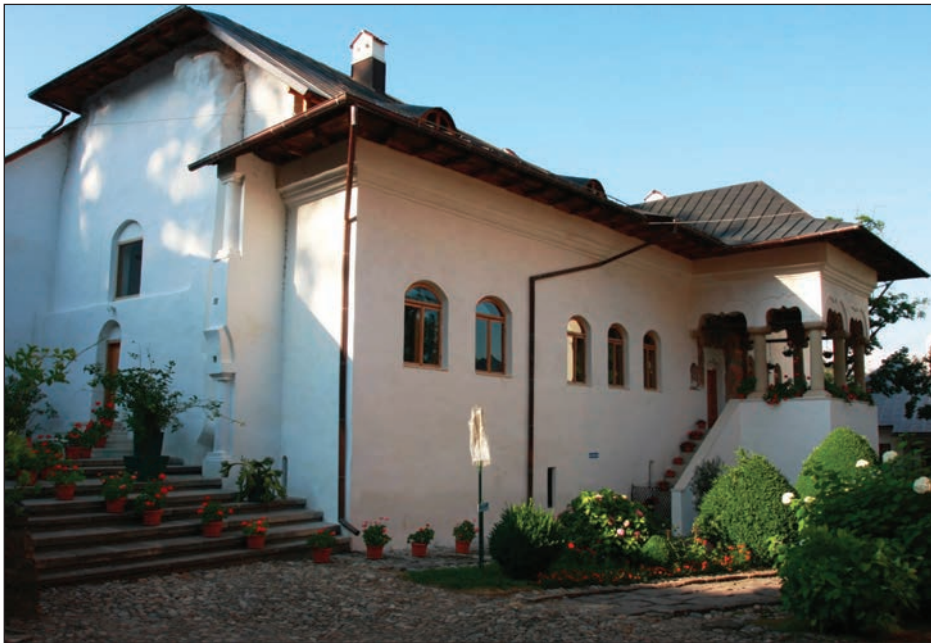
Fig. 2. Casa stăreției. Vedere sud-vestică.