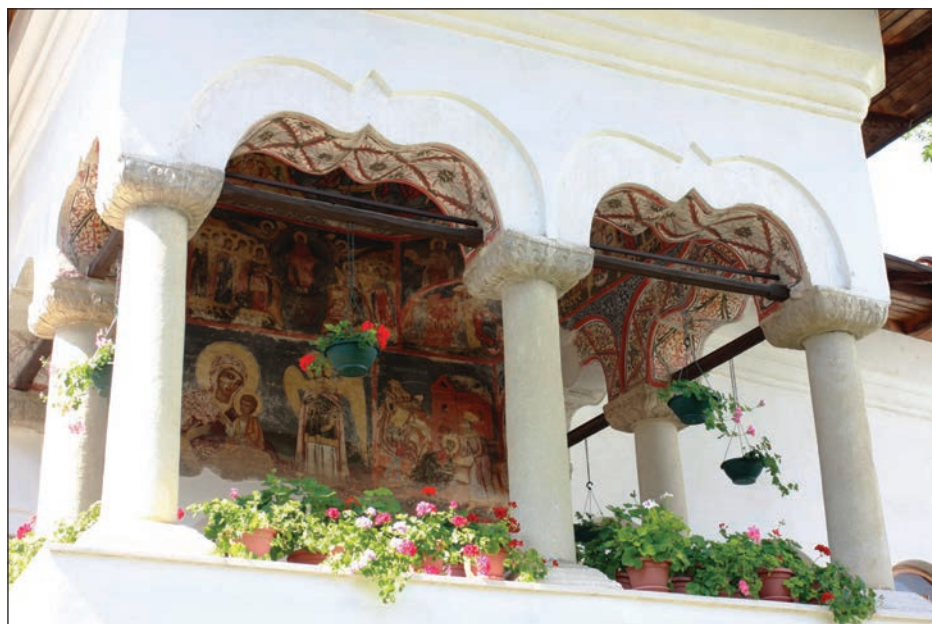
Fig. 6. Foișorul stăreției.