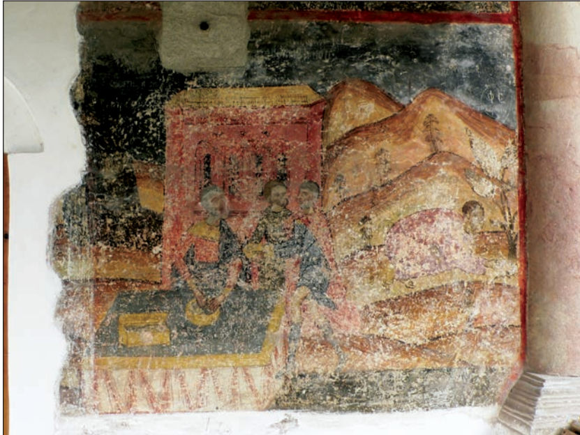
Fig. 8. Imnul Acatist. Condacul 9