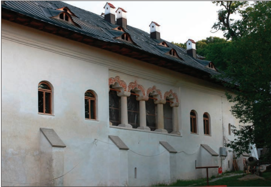
Fig. 3. Casa stăreției, vedere nordică. Loggia.