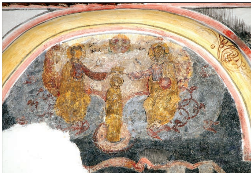
Fig. 5. Nașterea Maicii Domnului. Detaliu: Încoronarea Maicii Domnului de Sfânta Treime.