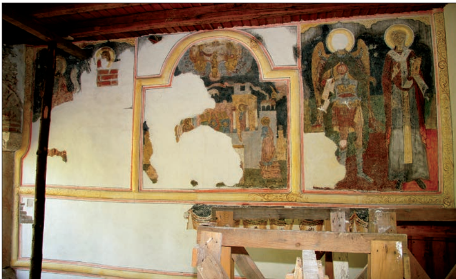
Fig. 4. Sala cu loggie. Peretele estic.