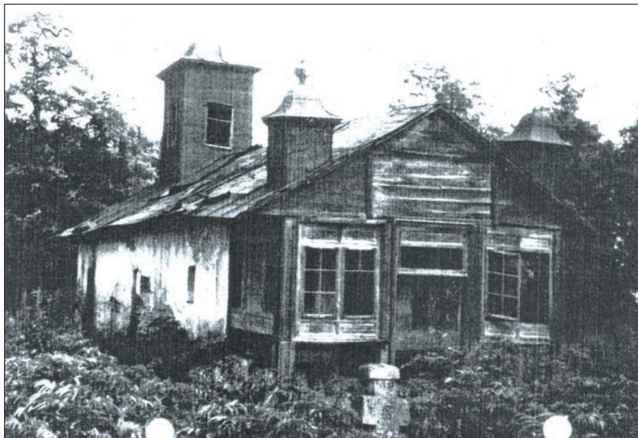
Fig. 9 - Biserica veche „Sf. Nicolae” (foto 1956, arhiva Parohiei Alexeni)/ La vieille église „Saint Nicolas” (photo 1956, archives de la Paroisse Alexeni)