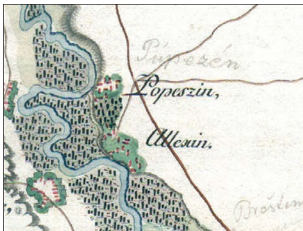
Fig. 3 - Specht 1790, mapa 89 (fragment)/ Specht 1790, la planche 89 (fragment)