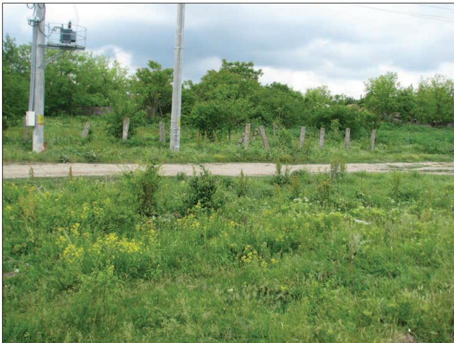
Fig. 6 - Vedere a cimitirului abandonat/ Vue sur le cimetière abandonné