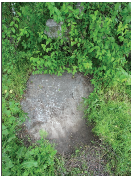
Fig. 8 - Piatră tombală de sec. XX/ Pierre tombale du XXe siècle