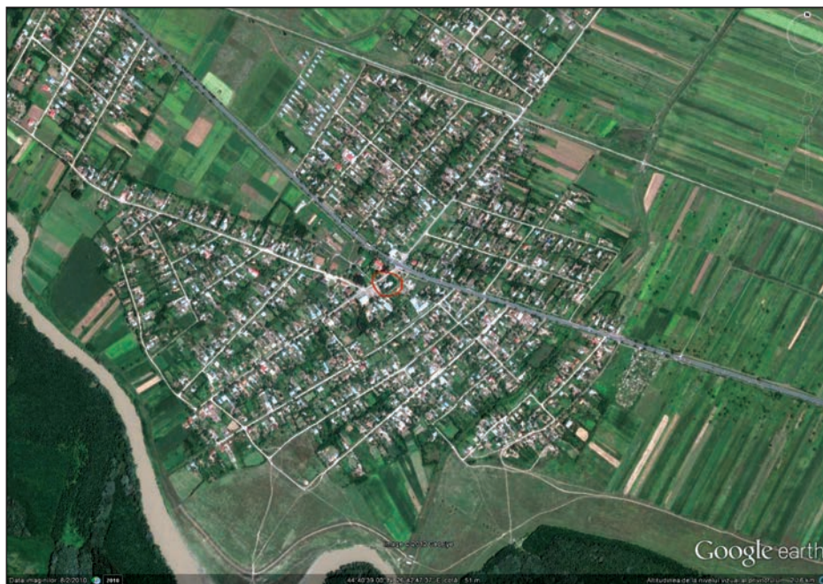
Fig. 1- Planul localității Alexeni (Google earth, accesat la 23.10.2012, ora 15.30)/ Plan d'Alexeni de la localité (Google earth, consulté au 23.10.2012, l'heure 15.30)

comoditate, neatenție, documentare precară), se translatează datele și atributele unui monument istoric care, în prezent nu mai există, către un lăcaș edificat ulterior, care are o cu totul altă istorie. Se produc astfel nu numai confuzii, ci și denaturări ale adevărului istoric într-un document (LMI) care ar trebui să fie un etalon de probitate științifică și o oglindă a situației actuale a monumentelor istorice de pe teritoriul României.