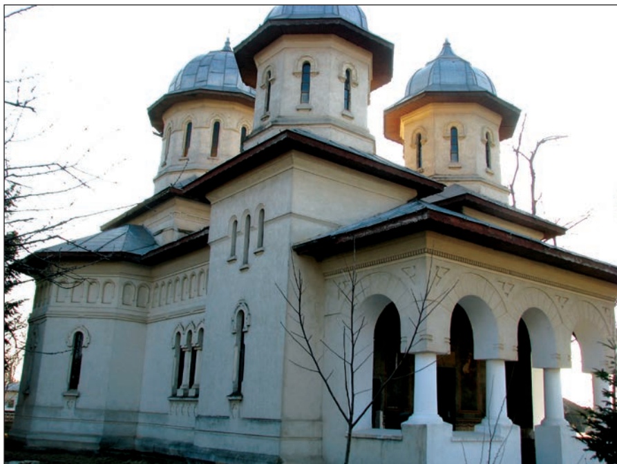
Fig. 2 - Vedere a bisericii actuale / Vue de l'église actuelle

de monument la cea de epocă contemporană, printr-o regretabilă eroare a celor care au întocmit LMI (variantele din 1992 și 2004). Punem la dispoziția celor interesați datele istorice referitoare la biserica satului Alexeni, astăzi dispărută, precum și argumentele pe baza cărora considerăm că aceasta a fost identificată greșit cu actuala biserică.