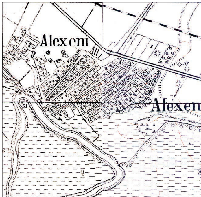
Fig. 5 - Harta militară 1952 (fragment)/ La carte militaire 1952 (fragment)