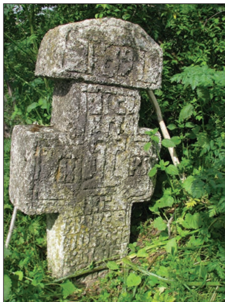
Fig. 7 - Cruce de piatră din sec. al XIX-lea/ Croix en pierre du XIXe siècle