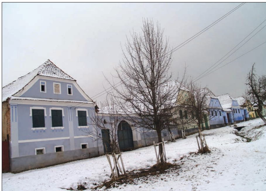
Fig. 6 - Viscri. Frontul de case sudic al Langgasse, cu fațade reabilitate de Mihai Eminescu Trust (MET) / Viscri. Southern front houses on Langgasse, with the facades rehabilitated by Mihai Eminescu Trust (MET)