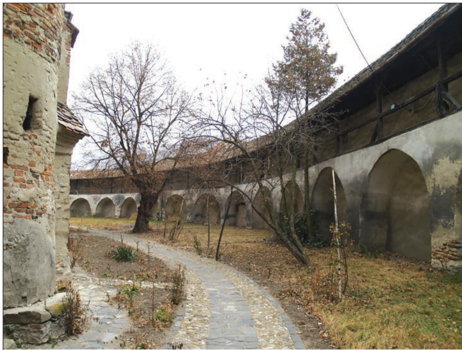
Fig. 4 - Valea Viilor. Biserica fortificată, zidul de incintă cu drum de strajă și sistemul de drenaj refăcut în 2011 / Valea Viilor. The fortified church, the enclosure wall with the watch road and the drainage system, restored in 2011