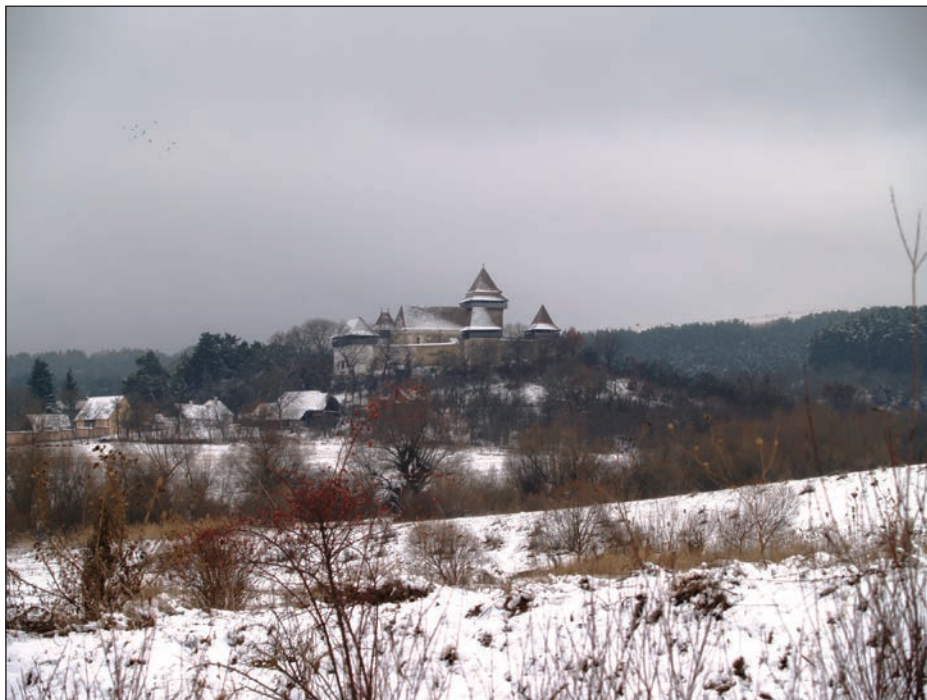
Fig. 1 - Viscri. Perspectivă asupra satului și a bisericii fortificate, dinspre nord; Viscri. perspective to the village from the North

Activitatea pe teren a constat în inspectarea monumentelor și a zonelor lor de protecție în scopul de a evalua rezultatele activităților de protecție întreprinse asupra acestora, în anul 2011.