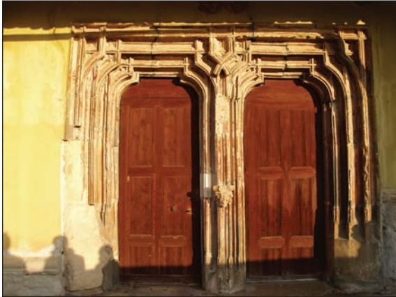
Fig. 7 - Biertan. Portalul de vest al bisericii evanghelice fortificate (c. 1500). Deteriorări și intervenții nocive / Biertan. West portal (about 1500) - deteriorations and harmful interventions

verticală iar fațada casei secundare s-a prăbușit de curând (în PUZ exista). 2. Intervenții necorespunzătoare la casele nr. 350, nr. 417 și nr. 449 (unde nu au fost respectate avizele). 3. Intervenții nocive la Sala de festivități din incinta bisericii evanghelice (placarea soclului cu piatră fixată în mortar de ciment, cu obturarea răsuflătorilor pivniței, care era deja în stare critică).