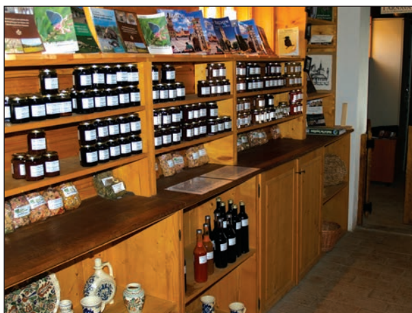
Fig. 10 - Saschiz. Noul Centru de Informare Turistică comercializează și produse tradiționale locale / Saschiz. The new opened Tourism Information Centre is also offering local traditional products

Viscri, Prejmer : cotidianul Transilvania Expres (Brașov) are o rubrică periodică despre monumente.