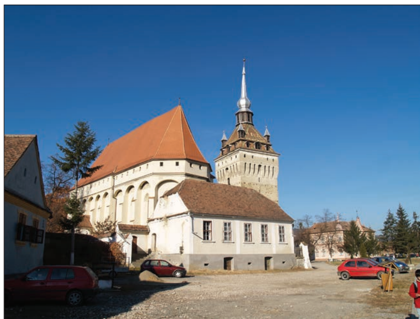
Fig. 3 - Saschiz. Biserica fortificată, restaurată 2000- 2011 și turnul clopotniță, inclus în Planul Național de Restaurare; Saschiz. The fortified church restored 2000-2011 and the bell tower, put on the National Restoration Plan (PNR)