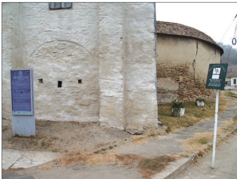
Fig. 9 - Valea Viilor. Biserica evanghelică fortificată. Panouri de semnalizare a monumentului / Valea Viilor. The fortified church. Signalling panels

2010 a produs tasarea și fisurarea terenului la est de cor, și împingeri în zidul de incintă. Ventilarea interioarelor turnurilor Muzeul și Turnul catolicilor a fost rezolvată prin instalarea unor grilaje în loc de uși. 4. La casa de pe str. Avram Iancu nr. 3, frontonul cu inscripție "1786" are fixat un cadru metalic pentru cabluri de curent electric. 5. Casa de pe str. Crișan nr. 36, ce definea caracterul centrului cartierului românesc, alături de școală și casa nr. 35, a fost demolată în noiembrie 2011, fără autorizație (Fig. 8).