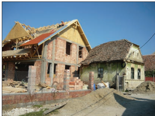
Fig. 8 - Biertan. Casa nr. 36 din cartierul românesc, demolată în decembrie 2011, fără autorizație / Biertan. House no. 36, in the Romanian quarter, demolished in November 2011, without authorization

Saschiz: 1. Casa nr. 318 este în stare gravă, cu învelitoarea căzută. Casa nr. 419 are frontonul ieșit din