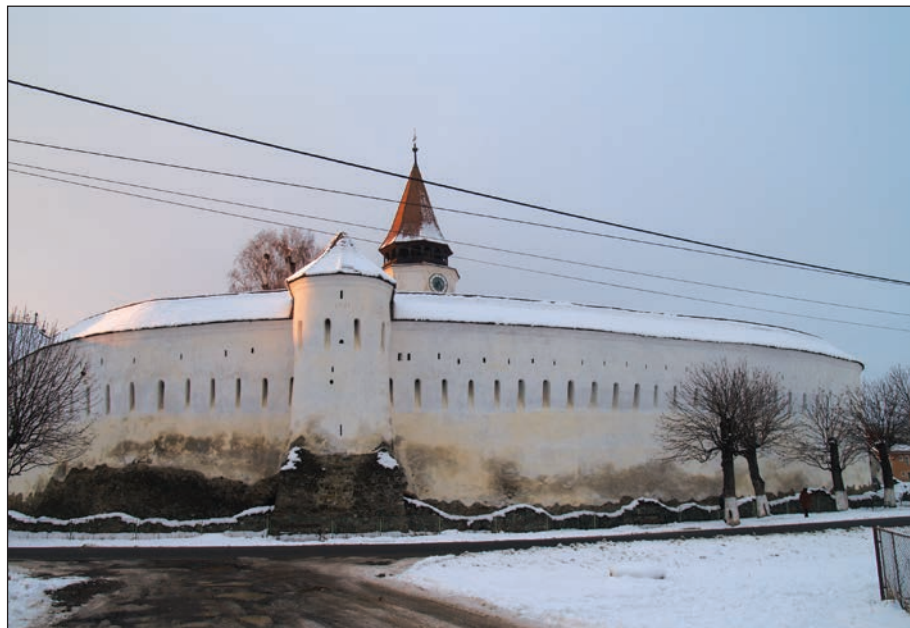
Fig. 5 - Prejmer. Perspectivă asupra bisericii fortificate dinspre sud-est; umiditate excesivă în ziduri / Prejmer. South- East perspective to the fortified church; humidity in excess into the walls