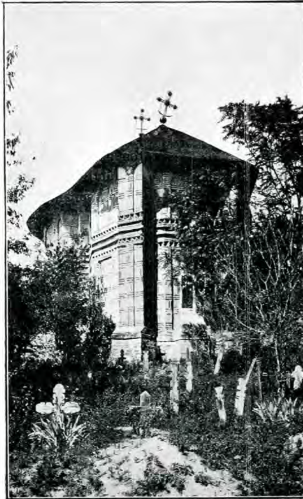
16. Biserica din Bălteni. Vedere spre altar.