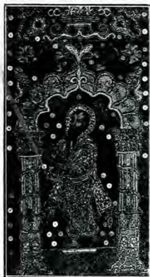
Casutară pe un patrarir dela Hurezi (1700).