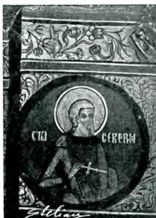
30. Paraclisul mitropolitan -- Sf. Severian --