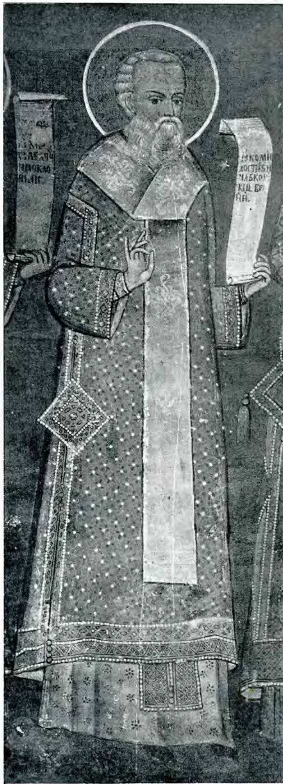
26. Paraclisul mitropolitan — Sf. Ierarh Grigorie Teologul —

jumătatea de sus în cinci compartimente.