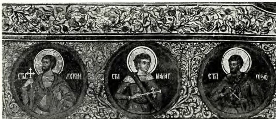
23. Paraclisul mitropolitan — Decorațiune pe peretele nordic —