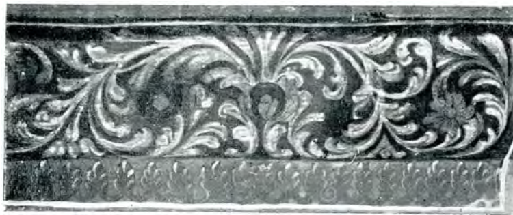
28. Paraclisul mitropolitan — Fragment de decorațiune —

Mercurie. Capul însă s'a păstrat bine și e de o expresivitate uimitoare. Nu m'am