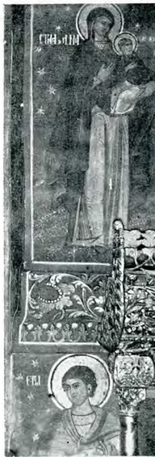
29. Paraclisul mitropolitan — Fragment de frescă: Sf. Ana —