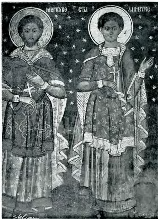
24. Paraclisul mitropolitan — Sf. Mercurie și Sf. Dimitrie —

decorațiunea sculpturală a monumentelor noastre istorice.