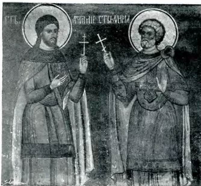
25. Paraclisul mitropolitan — Sf. Artemie și Sf. Mină —

Decorațiunea picturală a interiorului a fost făcută al fresco ca la cele mai multe din monumentele noastre vechi. Și aciînsă,