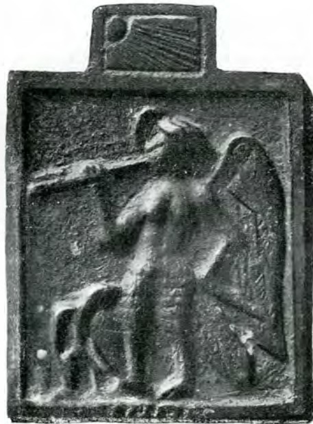
1. 18. Plăci cu reliefuri creștine găsite la Istros. 2.

Fig. 1 este o scenă de martiriu. Un tânăr ingenunchiat, cu mâinile ridicate în sus și împreunate în semn de rugăciune. În fața lui un personajiu, îmbrăcat în costum de împărat, cu coroana pe cap, se pregătește să lovească cu un topor într'un cui