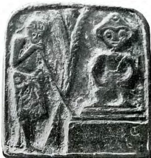
3. 19. Plăci cu reliefuri creștine găsite la Istros. 4.

stamentul unui idol, așezat la umbra unui copac. Pe postament se află următoarea inscripție, pe care, neputând-o descifra, o dau în facsimil: