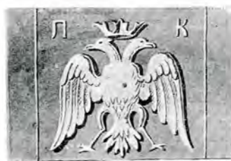
Ornamente în piatră dela Mănăstirea Bistrița.