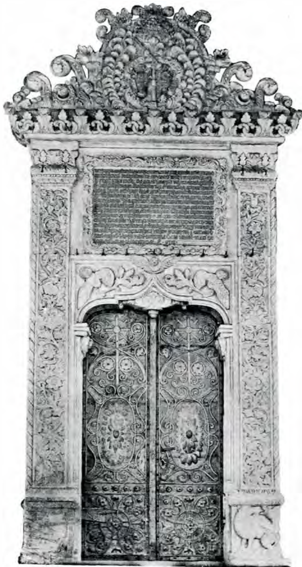
Portalul bisericii dela Văcărești.

Ipoteza că ar fi condus ambele lucrări nu poate