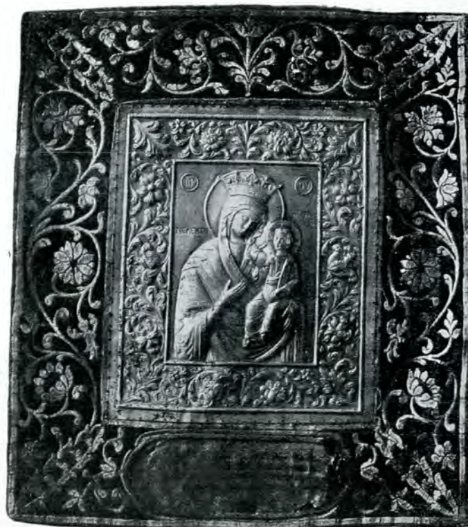
Iconiță a Maicei Domnului lucrată de argintarul sas George Mai, la Muzeul de antichități din București.