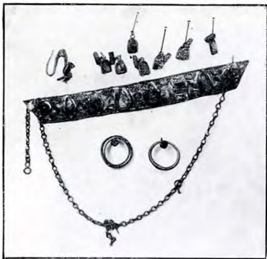
Obiectele de aur din mormântul dela Constanța.

Cel mai interesant dintre aceste obiecte este o lamelă de aur în formă de trapez, lungă de 12 cm., lată de 1.5 cm. și groasă