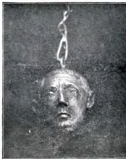
Capul statuetei de la Suluc.

s'au găsit, dar le-am și putut vedea pe toate.