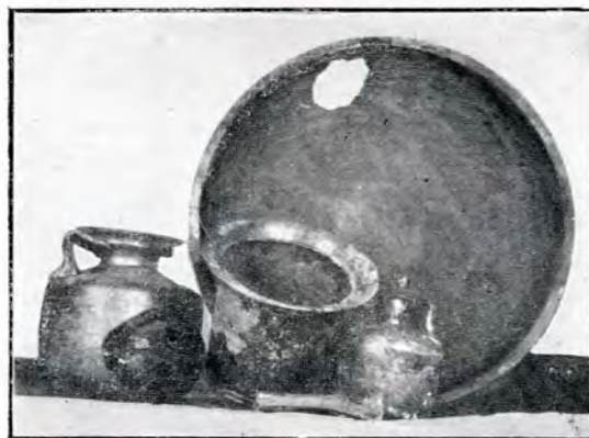
Tava de aramă, cănila de sticlă și urnele de lut din mormântul dela Constanța.

Cu ocazia lucrărilor de aliniere a străzii amintite s'a nivelat o movilă, în care s'a găsit o cameră mortuară formată din 5 plăci de piatră calcară, dintre cari două lungi de câte 2 m., alte două în lungime de 0.80 m. și o altă placă mai mare pusă de asupra. În launtrul acestei camere s'au găsit următoarele lucruri :