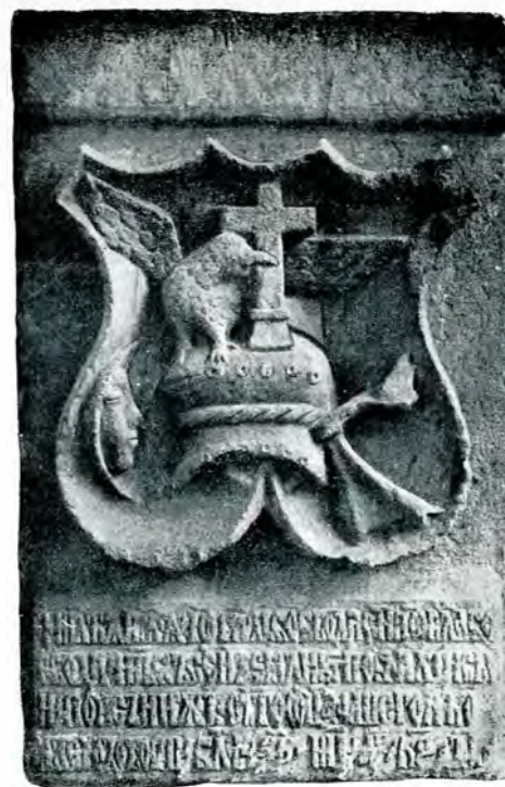
Inscripția vechei clopotnițe dela m-rea Dealul.

În partea inferioară a pietrii e săpată următoarea inscripție, din care căpătăm lămuriri asupra acestei interesante piese: