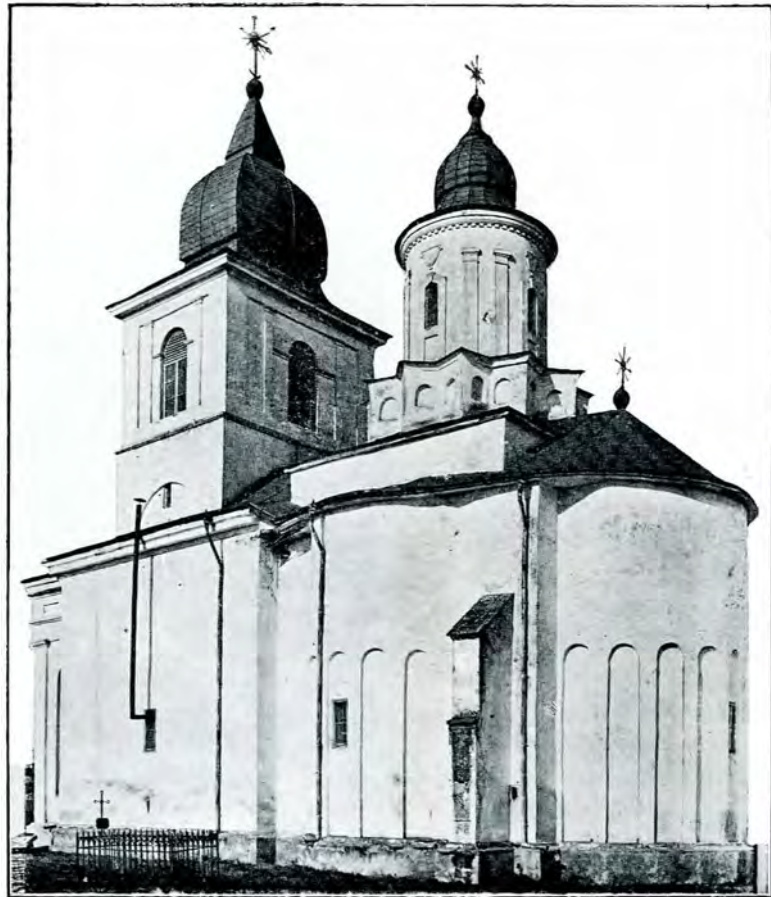
Biserica Precista din Bacău.

† Іо АЛЕКСАНДРО Воевод[к], сын Стефан Воеводо, г[р]ѣшк земаи Молдавскон, сконч[ен] сын