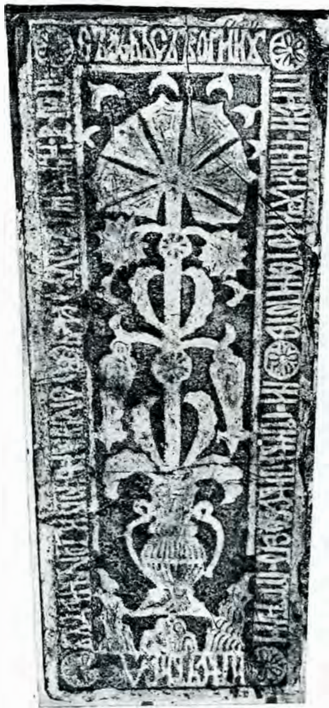
Piatră mormântală dela 1636.

Continuând desvelirea și spre capătul despre vest, unde trebuia să se afle capul mortului,