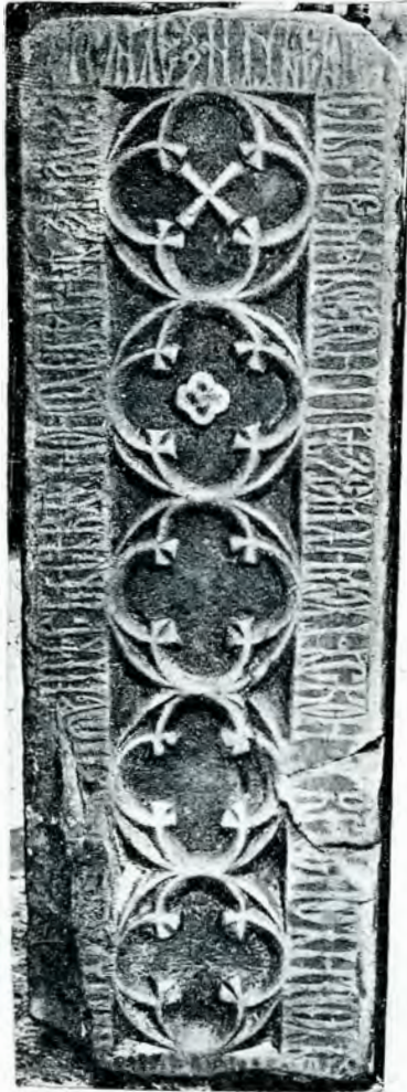
Piatră mormântală dela 1495.

Гъ(и) [гъ]объ съткори и скрочи паш Ми- хал Фотена, По(с)те(а)ши(к), кикршик скоро кв(с)тина. Пркставна къ дни богочи[ст]и- [к]и Іу В(а)с(і)ліе Вое[в]од. Вл(ѣ)то *зрмд. мѣд. д.ка.дн.