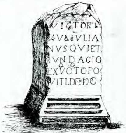
Altarul votiv (desemn) de la Serdaru.

trice, asemănătoare mai mult cu olăria pre-romană decât cu cea romană (fig. 4 și 5). Fabricarea lor, cred locală, e foarte înapoiată. Lucrate cu mâna, cu forme neregulate (fig. 2 și 3), rău arse, din pământ neomogen, rău ales, cu petricele și nisip, ele n'au putut rezista umezelii, presiunii și rădăcinilor plan-