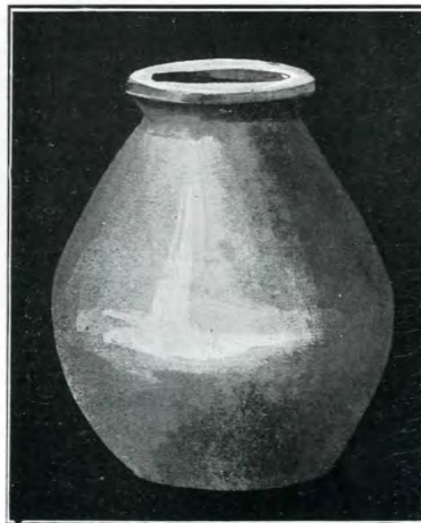
Fig. 42. Chiupe din Cetate

Piuliță de formă obișnuită, din piatră scoicoasă de calitate mediocră, găsită în cetate