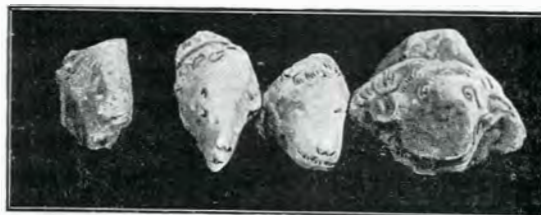
Fig. 29 32

mare 0 m ,22; dela bot până la ochiu 0 m ,13; dela bot până la corn pe frunte 0 m ,17; lățimea peste bot 0 m ,12; lățimea botului (maximum) 0 m ,04.