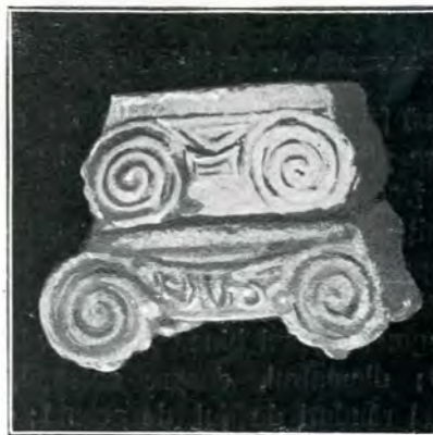
Fig. 10 (No. 12 și 13).

cele două laturi (în dos suprafața e lăsată netedă) ; între volute are ca ornament ovuri și palmete (fig. 12, jos).