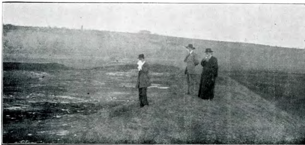
3. Cetatea de pământ de la Bărlad. - Vedere a colțului despre răsărit-miazăzi -

Membru coresp. al C. M. I. pentru jud. Tulova