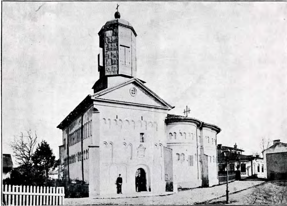
1. Biserica Sf. Gheorghe din Galați.

70 centimetri. Se compune din două părți deosebite și anume: dintr'o piatră de râu moale, sfărâmicioasă, în lungime de 90 centimetri, pe care e săpată inscripția ce ocupă