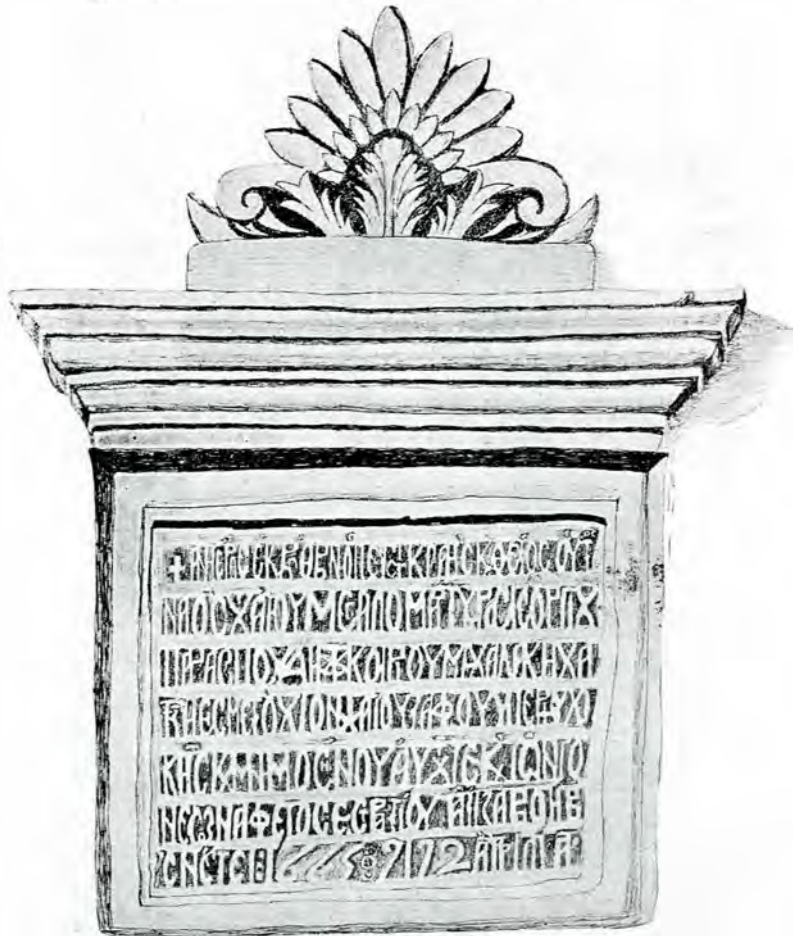
2. Inscripția bisericii Sf. Gheorghe din Galați.