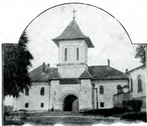
3. Noua clopotniță de pe noua intrare în curtea mănăstirei, pe strada Arhivelor, 1910.