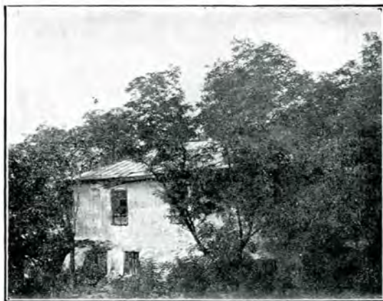
8. Fața din spre str. Milhăi Vodă, cu totul ascunsă trecătorilor, din pricina caselor zidite pe muchea dealului (vedere luată de pe acoperișul unei case), 1911.

vorbi de palatul din Dealul Spirei, care se va zidi doar la 1774, ci 'de Vechea Curte