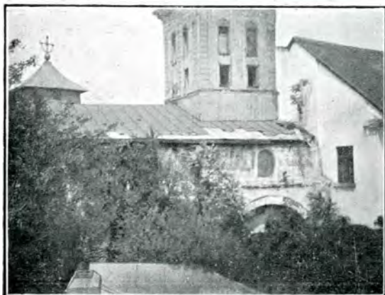
5. Vechea poartă de intrare în mănăstire, la răsărit, sub vechea clopotniță. În fund turla bisericii din mijlocul curții. La dreapta o parte din noua zidire împrejmuitoare (Arhivale): 1911.