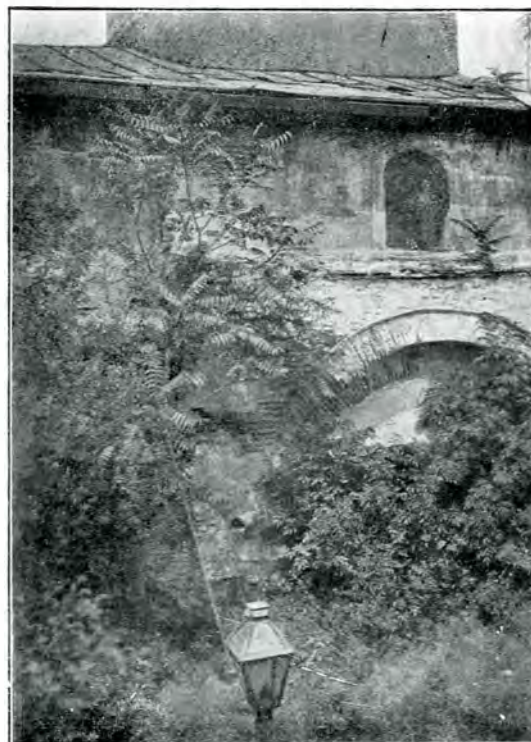
7. Intrarea de sub vechea clopotniță (Fațada spre Mihai Vodă, ascunsă astăzi de case). Vedere luată din vârful unui salcâm, 1911.