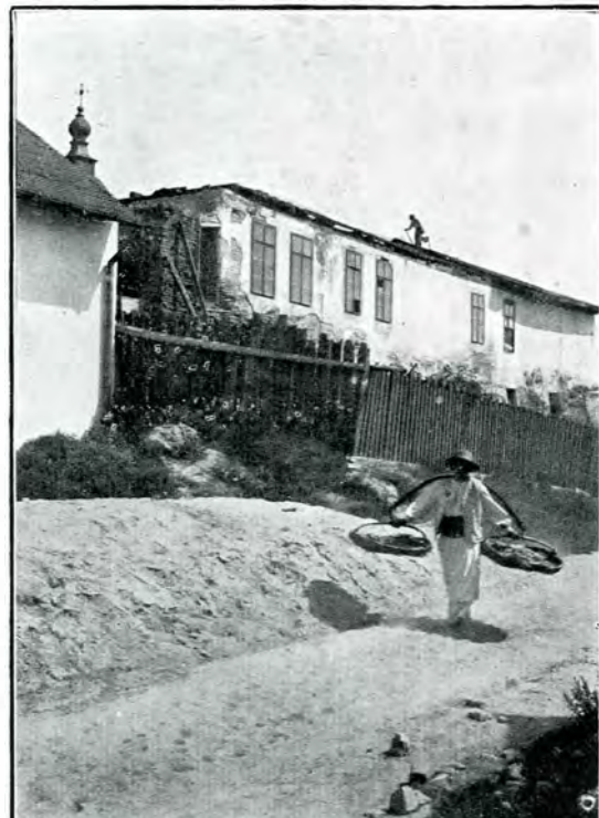
12. Fațada din străduța Arhivelor, în timpul dărâmării (1912).

șului București de Lt. colonel D. Papazoglu). Albumul lui Ainslie, după care s'a produs vederea, apare la 1801, așa că Chisbüll (1670—1733), citat de Ainslie, nu putea