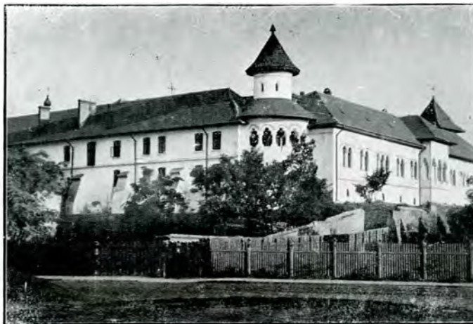
1. Arhivele Statului (Mănăstirea Mihai-Vodă după restaurare) Vedere luată de pe podul Dâmboviței 1910.

«Principii sau Voevozii, în deobște, țin