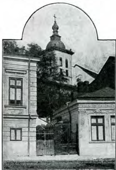
4. Vechea clopotniță, deasupra vechei intrări în mănăstire. (Fațada din str. Mihai Vodă, ascunsă de casele clădite pe muchea dealului), 1910.