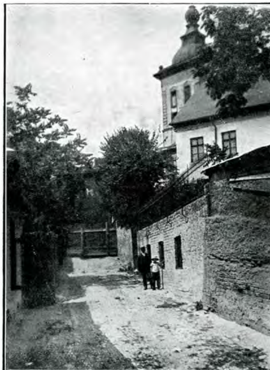
6. Vechea clopotniță și Vechea intrare în mănăstire, spre răsărit, prin ulicioara ce dă în str. Sf-ții Apostoli, 1911.