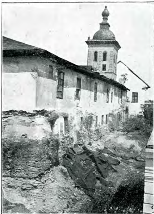
9. Aceiași fațadă din spre str. Milhăi Vodă, după tăierea salcânilor, în 1912.

șului București de Lt. colonel D. Papazoglu). Albumul lui Ainslie, după care s'a produs vederea, apare la 1801, așa că Chisbüll (1670—1733), citat de Ainslie, nu putea