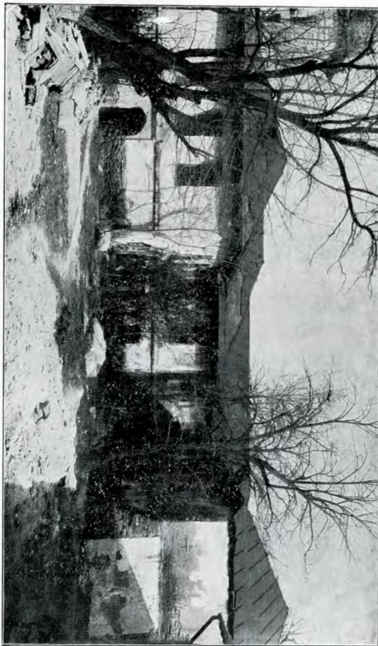
12 Mănăstirea Mihai-Vodă, interiorul, la 1910. Cliseul d-lui Capitan N. Uică, publicat în : Istoricul Școlii Militare de Infanterie, 1847 — 1911 . Localul arhivelor a fost al patriilei organizat de Școala Militară.

Reproducând mai jos câteva vederi luate înainte de reînnoirea mănăstirii, să-mi fie îngăduit a expune și în acest Buletin, cu