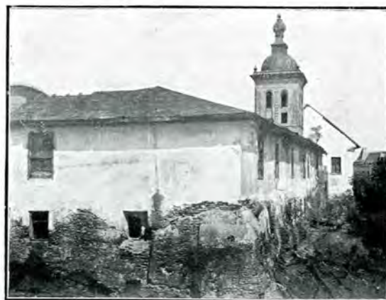
10. Colțul str. Arhivelor și str. Milhăi-Vodă. (Se vede clopotnița veche, turla bisericii din mijlocul curții

Curtea Arsă , zidită la 1774 de Al. Ipsilante, e distrusă de un incendiu la 1814, în zilele lui Ion Caragea (Istoria fondării ora-