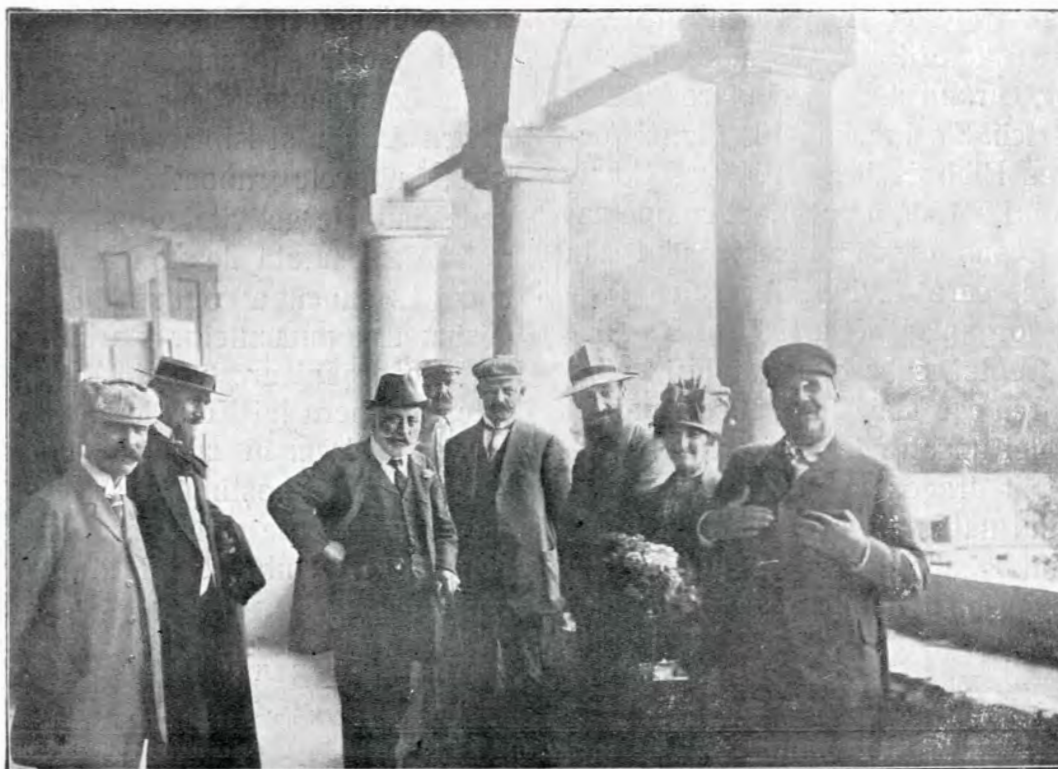
2. La Hurezi, 12 Iulie 1912.