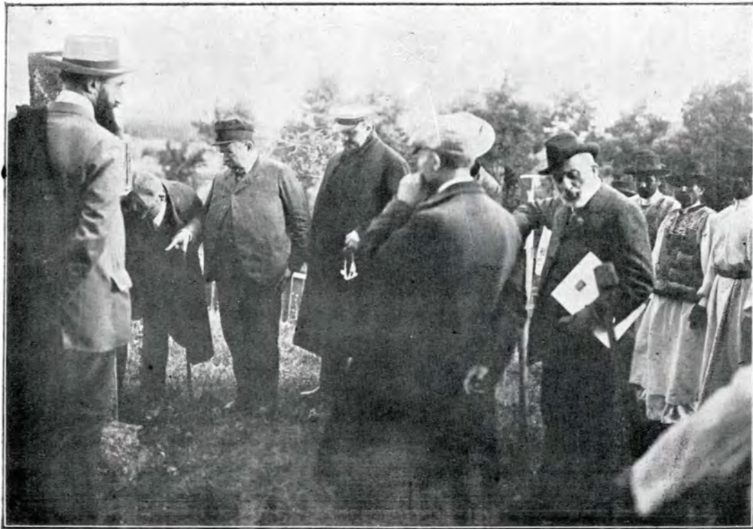
3. La Brâncoveni, 15 Iulie 1912.