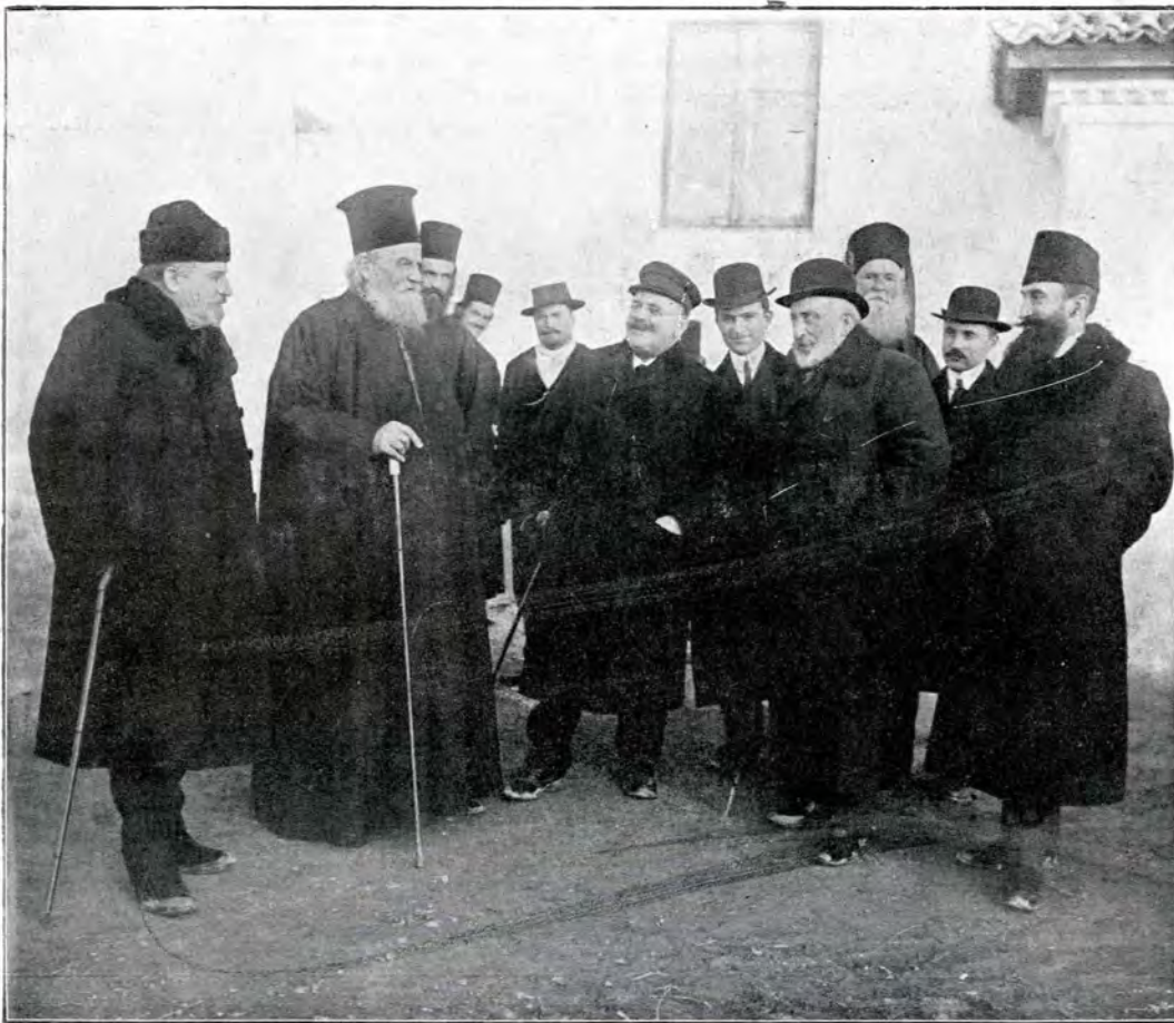
4. La Căldărușani, 8 Decembrie 1912.