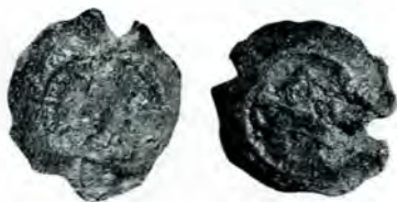
Fig. 2, a și b.

A) Legenda circulară de pe avers ne e păstrată mediocru numai în parte, până la creștetul efigiei, restul e deteriorat. Se poate reconstitui: D. N. ANASTASIVS P. F. AVG|. Bustul, din față, al împăratului cu diademă și drapat.