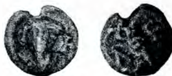
Fig. 6, a și b.

A. Bustul unui sfânt între două cruci aliate.