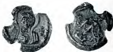
Fig. 5, a și b.

4. Alt sigiliu din seria veche byzantină (Pe față avem însă un chip de sfântă, pe revers o monogramă).