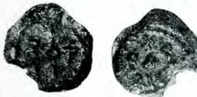
Fig. 3, a și b.

2. Interesant și nou e și un al doilea sigiliu. Pe față, literele, de caracter latin, ce compun numele posesorului sunt așezate așa fel, încât împreună cu o cruce mică, formează dela sine o monogramă în chip de cruce.