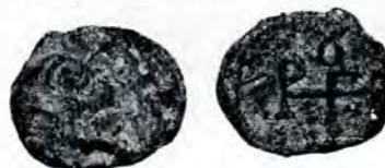
Fig. 7, a și b.

A) Fața e deteriorată jos, din cauza canalului, stricat la extremitatea aceasta. Efigia e, în general, ștearsă; ceea ce a mai rămas din contur pare a indica o figură călare spre stânga — probabil Sf. Gheorghe. O atare reprezentare nu e frecventă 6) .