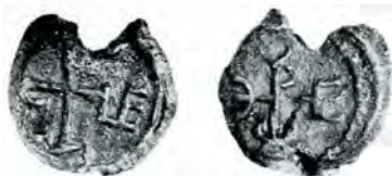
Fig. 4, a și b.

Numele și titlatura posesorului stau tănuite în câte o monogramă—una pe față, a doua pe revers—, amândouă înghebate samar și într'un chip de neînțeles. Face parte dintr'o serie de plumburi byzantine din sec. VI-VII, cu caracteristica văzută la cel de față. Unele pot fi descifrate 3) .