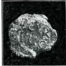
Fig. 1 a și b.

De-o înfățișare de sigilia (v. fot. fig. nr. 1 a și b), plumbul are în diametru ca. 24 mm. și prezintă și pe o față și pe cealaltă un spațiu ca de 18 mm., «câmpul» inscripției. Își păstrează încă destul de bine și unul din cele două orificii (fig. nr. 1 a) dela un capăt al perforării prelungite transversal prin plumb și perforația însăși, prin care se petrecea sfoara cu ajutorul căreia plumbul era prins de legăturile cu marfă, spre a le indica oarecum integritatea în trecere prin diversele stationes până la local de destinație.