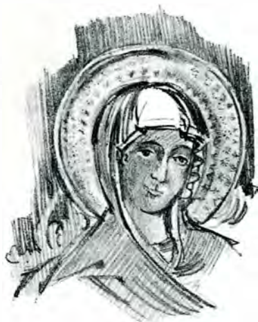
1. Sf. Paraschiva, fresc în bis. din Muierasca de sus.

Pe dinafară, înfățișarea de total a acestei biserițe este umilă și săracă: și, pare mai umilă prin dărâpănarea în care a fost