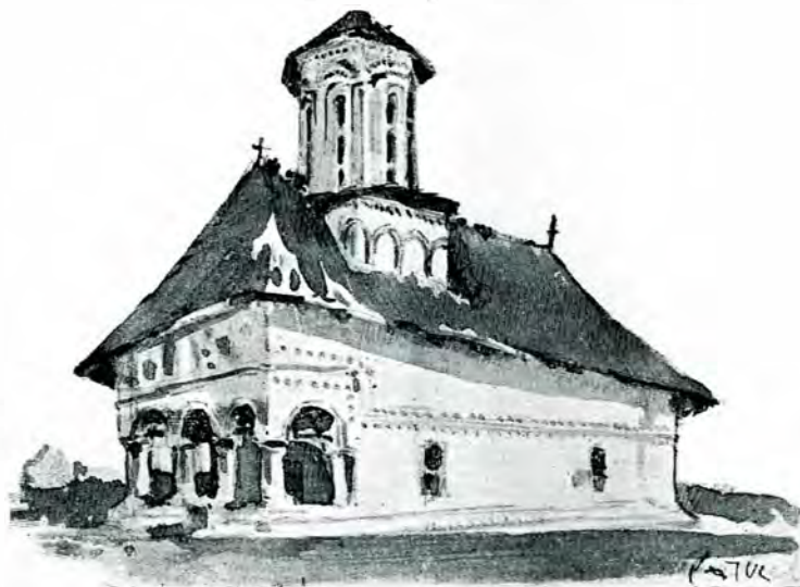
4. Bis. „Sf. Voivozi” din Olănești.

Cu vreaarea Tatălui și cu ajutorul Fiului și cu săvârșirea Sfântului Duh, amin. Ziditu-s'au această sfântă besearică intru cinstea și lauda sfântului arhiereu Nicolae, den temelie, cu toată cheltuiala robului (lui) Dum-