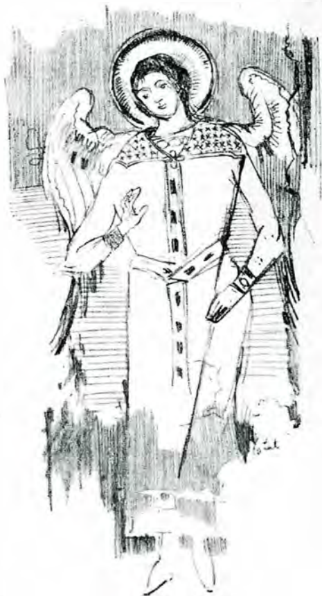
2 Sf. Arh. Mihail, fresc în aceeași biserică.

lăsată. Dar pe cât de urit îi este exteriorul, pe atâta te uimește frumusețea zugră-