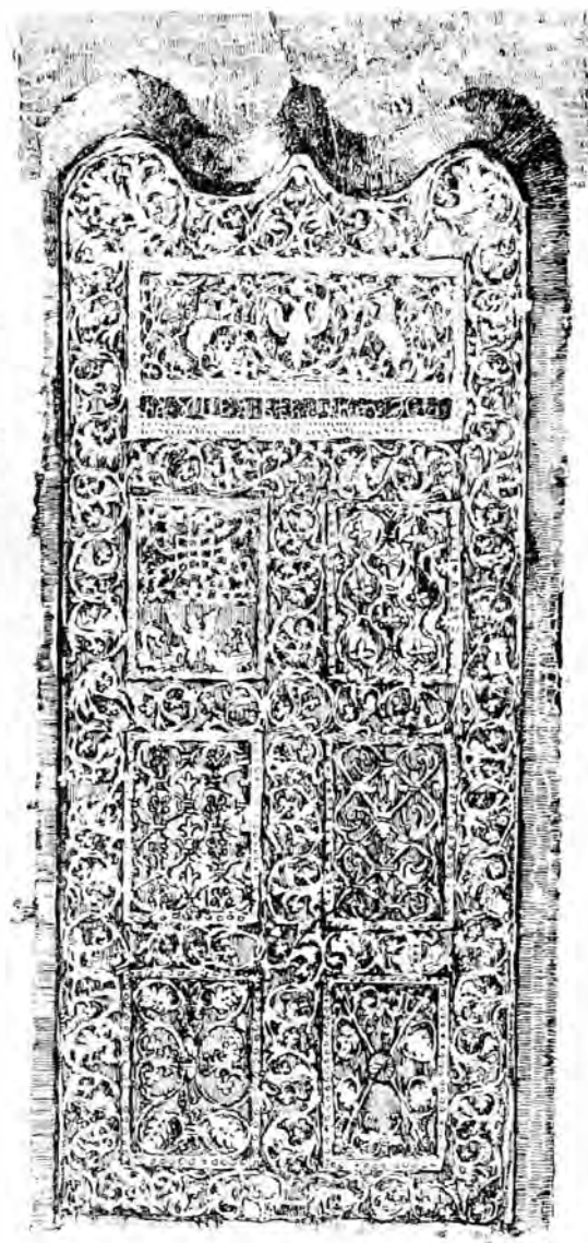
3. Ușa bis. «Sf. Nicolae» din Olănești.

În pronaos, pe peretele dela intrare și la dreapta uși, se găsesc chipurile ctitori-