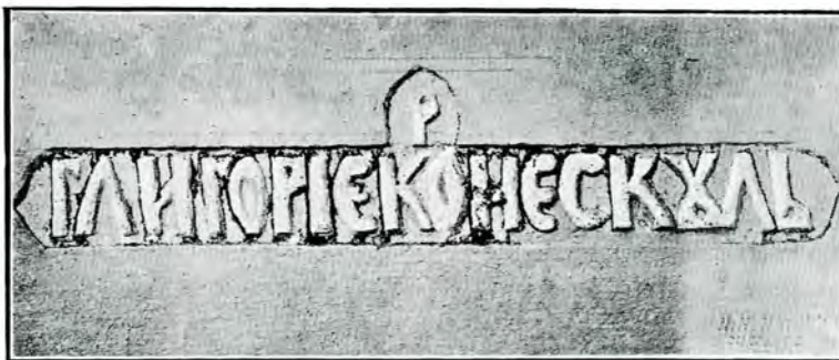
14. Inscripția lui „Gligorie Cornescul” de la bis. ep. din C.-de-Argeș

După acea notiță a mea, mi-am adus aminte că numele lui „Gligorie Cornescul” figurează și pe zidurile exterioare ale bisericii episcopale din Argeș (v. fig.). Acei cari au dat cetirea inscripției puse de Șerban Cantacuzino ca restaurator al măreței clădiri în partea stângă a ușii de intrare, —partea dreaptă coprinzând, în această refacere a fațadei , inscripția lui Neagoie, care