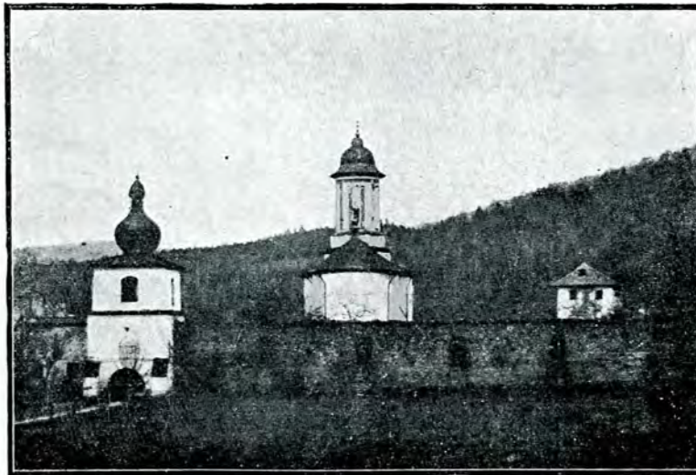
1. Foasta m-re Tazlău : vedere generală.

«Io Ștefan Voevod, ca mila lui Dumnezeu Domn al țerii Moldovei, fiul lui Bogdan Voevod, a înălțat acest hram întru numele Precistei Născătoarei de