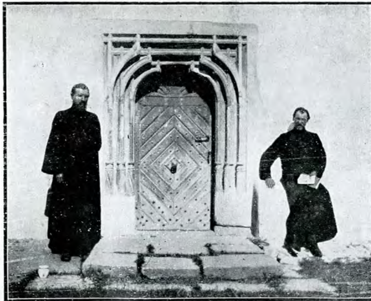
4. Ușa din afară a bis. Tazlău.

Pronaosul nu e despărțit de naos prin stâlpi, iar altarul nu ne înfățișează nimic caracteristic. Deasupra naosului se ridică și aici tarla cilindrică, sprijinită pe acelaș sistem original de boltire: patru arcuiri cari alcătuiesc cu ajutorul triunghiurilor sferice (pendentivi) baza circulară pe care se înalță alte patru arcuiri de cere așezate diagonal pe cheile