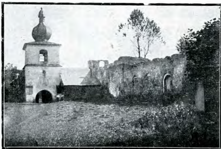
2. Foasta m-re Tazlău: clopotnița și ruinile chiliilor.

Intr'un stil serios, fără prea multe or-