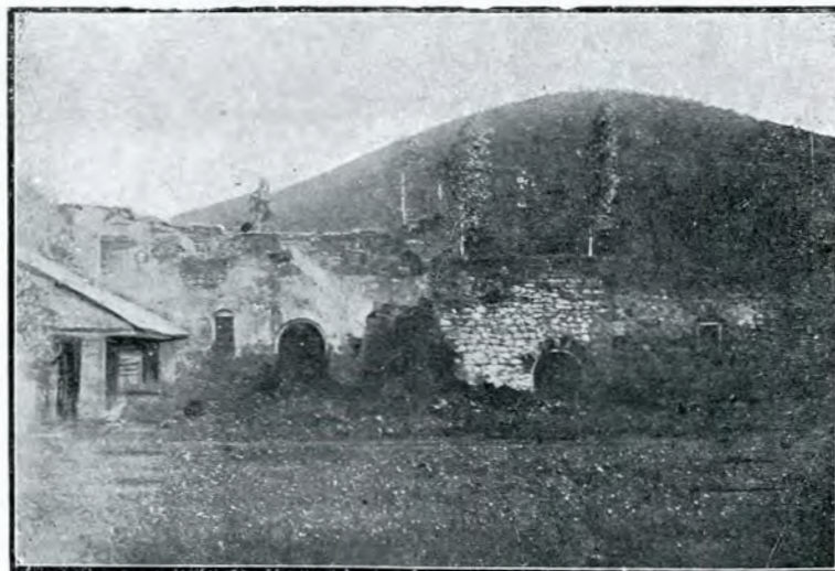
3. Ruinile chiliilor foastei m-ri Tazlău.

Neasemănat de frumoasă însă e așă laterală (fig. 4), care dă în pridvor, singura intrare a bisericii. Nervurile gotice se întretaie în unghiuri drepte și cad apoi ca mici colonete în câte trei șirari. Această