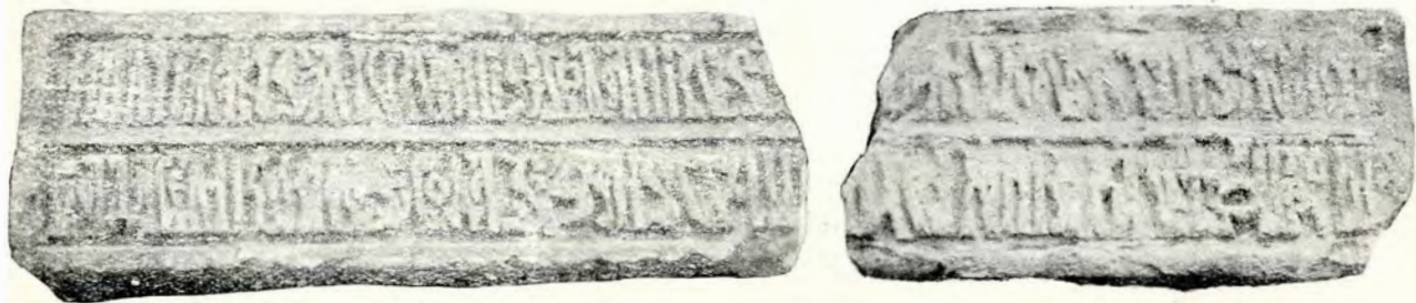
Fig. 1. Târșor. Pisania Bisericii din deal

Biserica lui Țepeș, așa cum se înfățișează azi, nu mai represintă forma originală, ci una prefăcută de două ori: întâiu sub Constantin Brâncoveanu, care e arătat ca ctitor, împreună cu Doamna sa Marica, a doua oară în prima jumătate a secolului