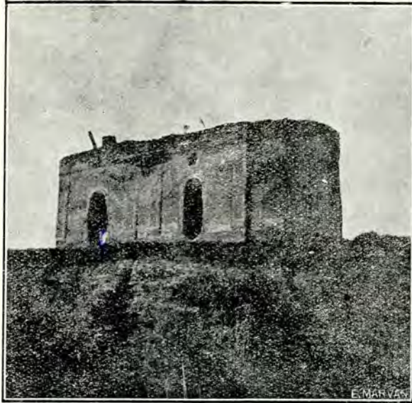
Fig. 2. Târșor. Biserica din deal.

din Târșor 1) , care presintă, din punct de vedere arhitectonic, o asemănare remarcabilă cu cea dinfăiu,