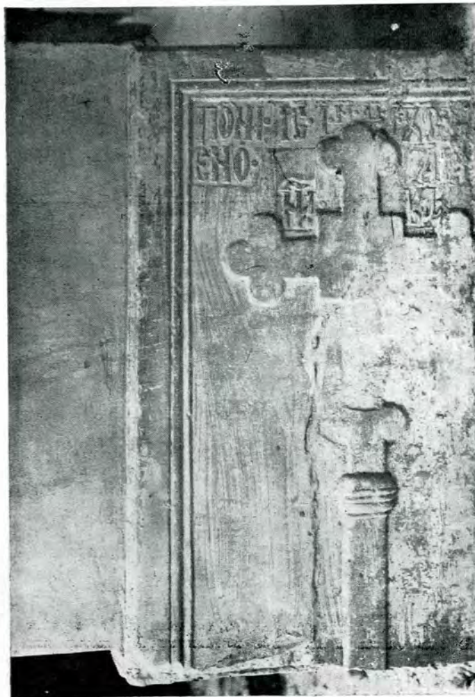
Piatra cu inscripție grecească din biserica de la Piua Petrei (fig. 1).