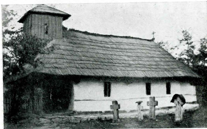
Fig. 1. — Biserica din Copăceni.

Biserică din Titești este caracteristică: cu pridvor pe patru coloane, cu arcade rotunde, pronaosul despărțit prin zid de naos, tâmpla de zid. Turla, de formă octogonală, cu trei rânduri de zimți, este așezată de-asupra pronaosului: are patul pătrat; arcadele ferestrelor de asemeni cu zimți. Este zugrăvită pe din afară, având pe lângă sfinți și un nu-