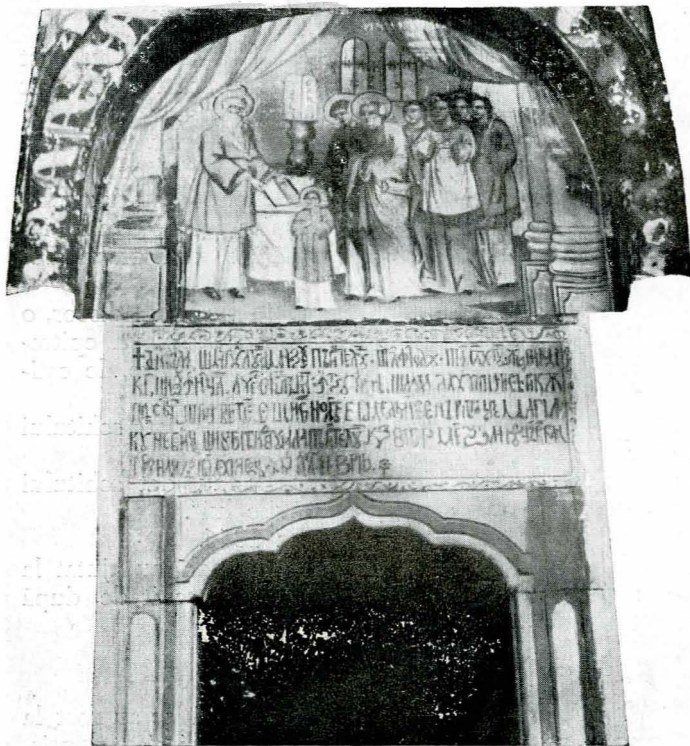
Fig. 3. — Mănăstirea Turnu, Pisania.

Pridvor deschis. Zugrăveli: 1) Dumnezeu: Facerea lumii. 2) Facerea dobitoacelor. 3) Zidirea lui Adam.