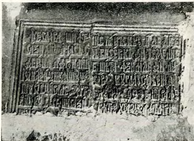
Fig. 2. — Inscriptia.

Restul e acoperit de cimentul unei reparații în curs.