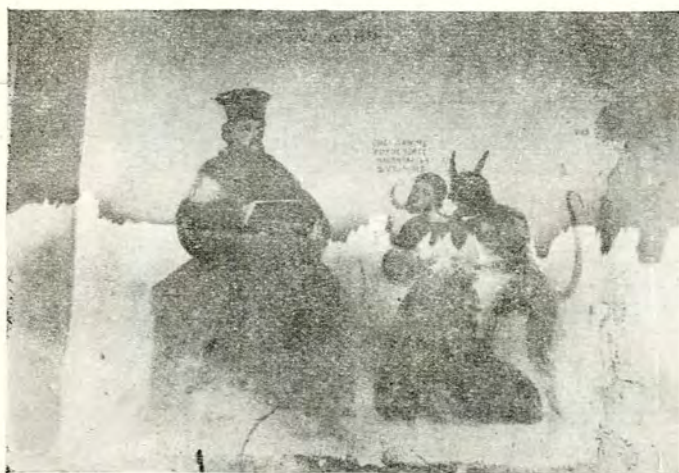
Fig. 5. Pictura pe un pãrete exterior.

Evtene ermonah, Tița erița, Dumitra, Ilinca, Ion, Iona, Vlădu ereu, Ilinca, erița Oprea, Ilinca, Grigorie 1 .