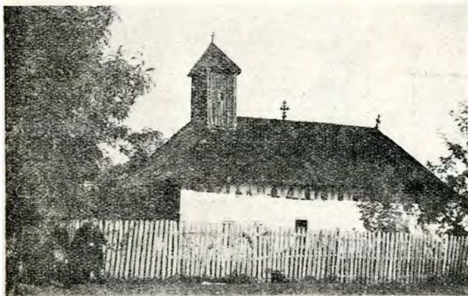
Fig. 1. — Biserica din Albota.

În Albota, adică în satul Albotei, al lui Albotă, din județul Argeș, pe linia ce se lasă în jos către Slatina, se ascunde