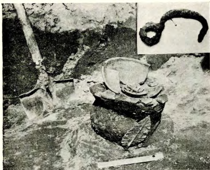
Fig. 4. — Un mormânt celtic în situ și fibula de fier găsită în urna funerară (La Tène). Ostrovul Corbului (1933).

După Celți, Romanii. În Ținuturile noastre oltenesti, ca și în acelea ale Banatului, viața ro-