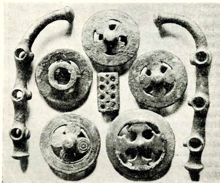
Fig. 3. — Bronzuri găsite în tumulul 2 (Hallstatt D) de la Balta Verde.

Răspândirea antichităților celtice ni arată că Celții nu s'au mulțumit numai cu valea Dunării