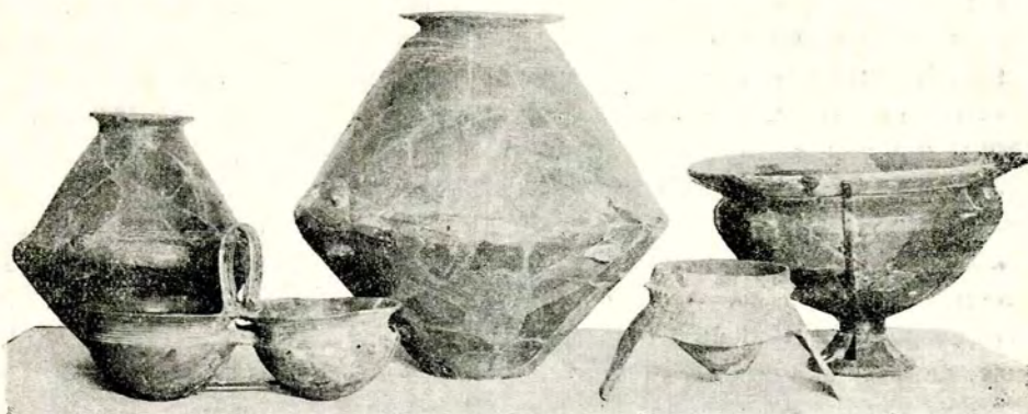
Fig. 2. — Ceramică hallstattiană locală, daco-getică (Vârtop și Ploșșor-Dolj).

Acest tip de civilizație face parte dintr'un mare